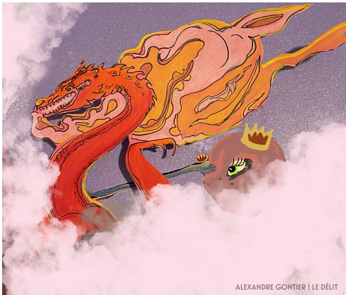
ALEXANDRE GONTIER | LE DÉLIT

Les contes de fées sont puissants ; qui ne connaît pas le trope du prince charmant sauveur qui délivre une princesse sans défense d'une menace quelconque? Les stéréotypes résultant de la perception genrée du prince actif et de la princesse passive nous sont sans cesse renvoyés à travers les figures du prince sauveur, de la princesse en détresse et de la menace, trois figures qui se définissent mutuellement grâce à leur position respective par rapport aux rôles des deux autres. Ainsi, la princesse en détresse doit sa raison d'être à une relation d'adversité entre une menace et un prince sauveur, tout comme la menace tient son rôle d'antagoniste grâce à la relation « sauveur-sauvée » entre le prince et la princesse. Le prince charmant, quant à lui, ne pourrait pas être le sauveur en armure en l'absence d'un adversaire qui l'empêche de gagner les faveurs d'une princesse « adorée » à délivrer. Selon l'anthropologue Emily Martin dans un article écrit en 1991, ce trope serait tellement ancré dans notre imaginaire collectif qu'il influencerait nombre des récits que nous construisons afin de donner du sens à la vie, incluant notre perception de la fécondation entre le spermatozoïde et l'ovule dans la littérature scientifique.