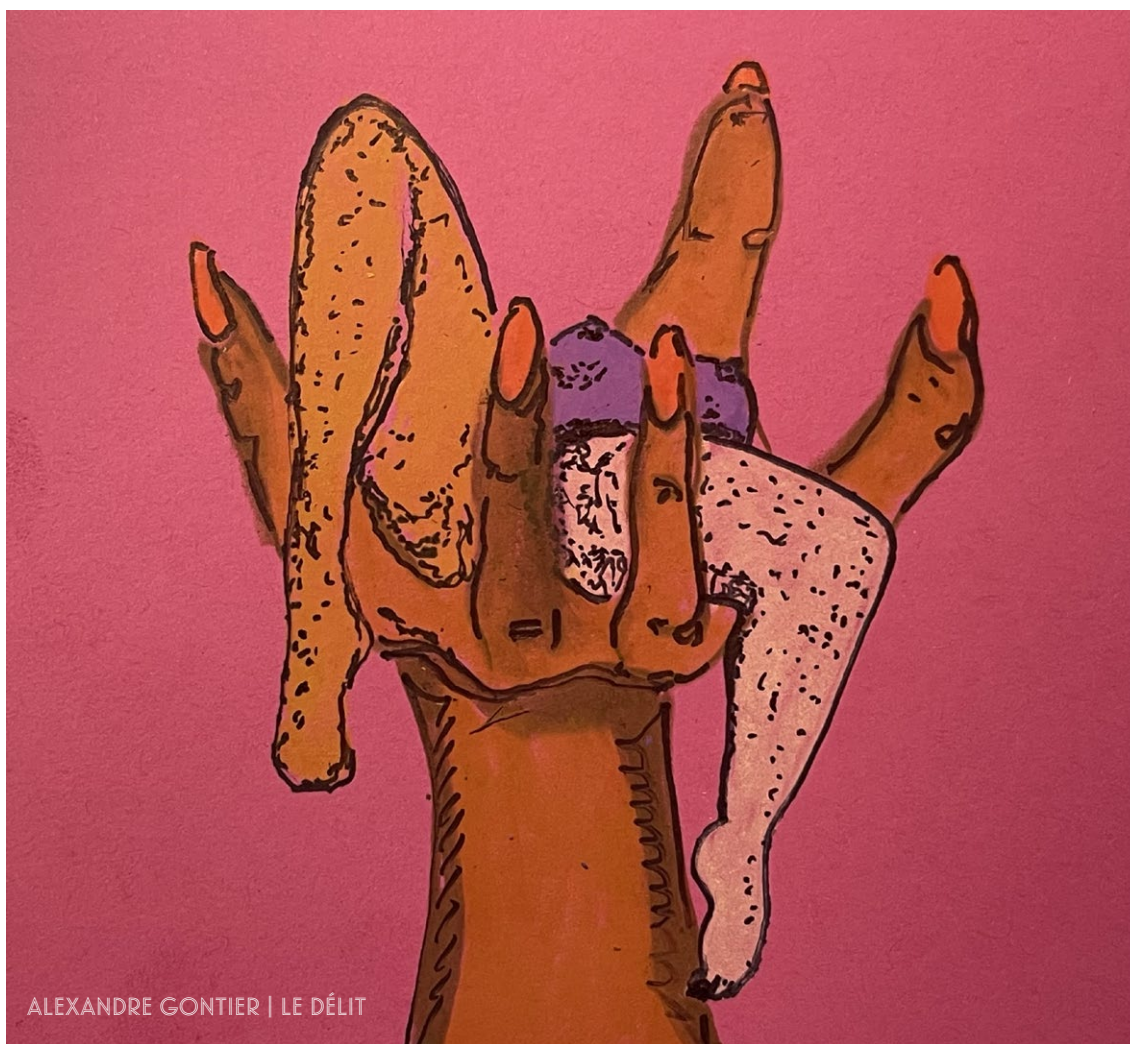
ALEXANDRE GONTIER | LE DÉLIT

Le porno féministe apporte donc des discours divers quant à des sexualités tout aussi diverses, permettant de concurrencer le discours unique que propageait jusqu'ici le porno traditionnel ; des discours qui semblent enfin décomposer la question du tabou dont le flou profitait à l'industrie de la pornographie mainstream . Mais si la pornographie éthique attire l'attention des consommateur-rices à la recherche d'une pratique plus représentative et déontologique, cette transition a un coût. En effet, si l'industrie du X a habitué ses auditeur-rices à accéder à un contenu gratuit, la pornographie éthique ne capitalise pas sur la publicité au même degré que l'industrie pornographique traditionnelle. Ainsi, payer pour sa consommation de pornographie, c'est non seulement garantir un salaire et des conditions de travail convenables aux artistes, mais c'est aussi permettre à la pornographie éthique de gagner en notoriété en lui permettant d'effectuer des productions et des tournages plus coûteux et donc plus élaborés. Pour autant, tout ce qui est étiqueté éthique et féministe ne l'est pas nécessairement, et comme dans tout type de consommation, il faut savoir se renseigner sur ce que l'on consomme. ☹