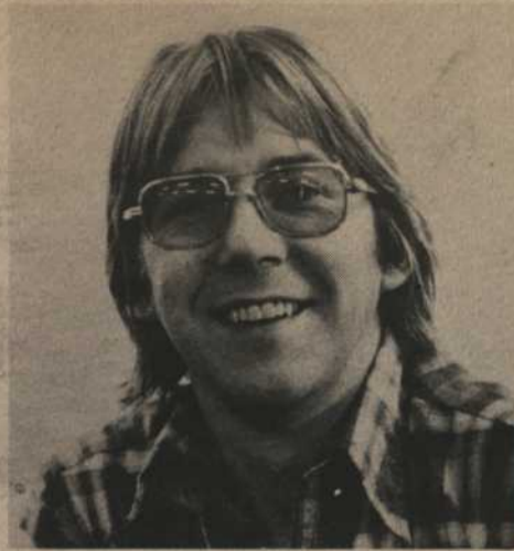
Rémy Girard un homme du village, un soldat Anglais, un Patriote, Thomas-Marie Chevalier de Lorimier.