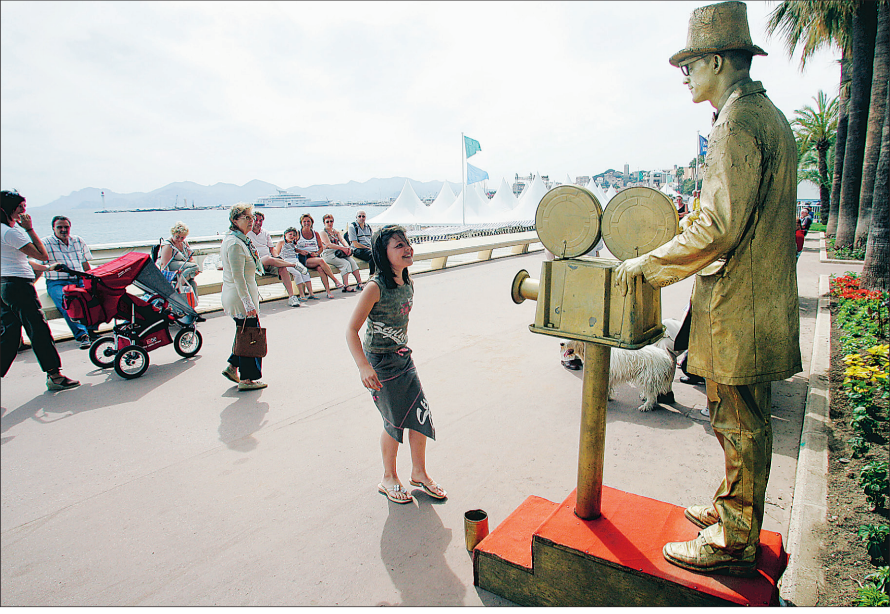
Tout le monde se prépare pour le Festival de Cannes, qui s'ouvre aujourd'hui : les jeunes filles jouent aux starlettes et les mimes ont déjà pris la pause.