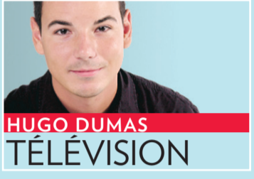
HUGO DUMAS TÉLÉVISION

C'est le monde à l'envers : le gala qui célèbre l'excellence en télévision québécoise ne passera pas à la télé l'automne prochain. Idem pour le pré-gala, que diffuse traditionnellement RDI. Radio-Canada a confirmé hier qu'elle ne prenait aucune des deux cérémonies des Gémeaux à son antenne.