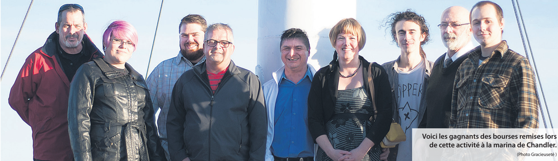
Voici les gagnants des bourses remises lors de cette activité à la marina de Chandler.