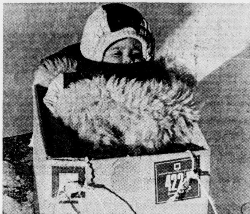
Cendrillon et sa "422"

Nous invitons les organismes de loisirs à but non lucratif à nous faire parvenir leurs communiqués au plus tard le mercredi de chaque semaine.