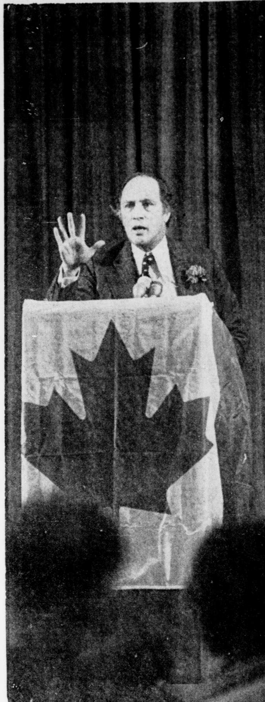
Lors de son premier discours à Québec hier soir, le premier ministre Trudeau a développé les principaux thèmes qu'il entend faire valoir à l'occasion des "mini-référendums" du printemps.

D'autre part, le rapport du groupe de travail à Mirabel recommandant le bilinguisme pour les vols à vue a été déposé devant la commis-