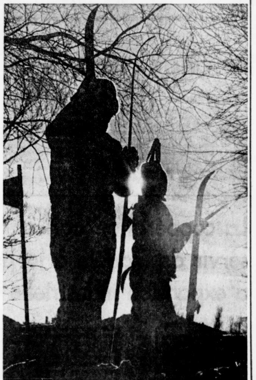
C'est beau l'hiver