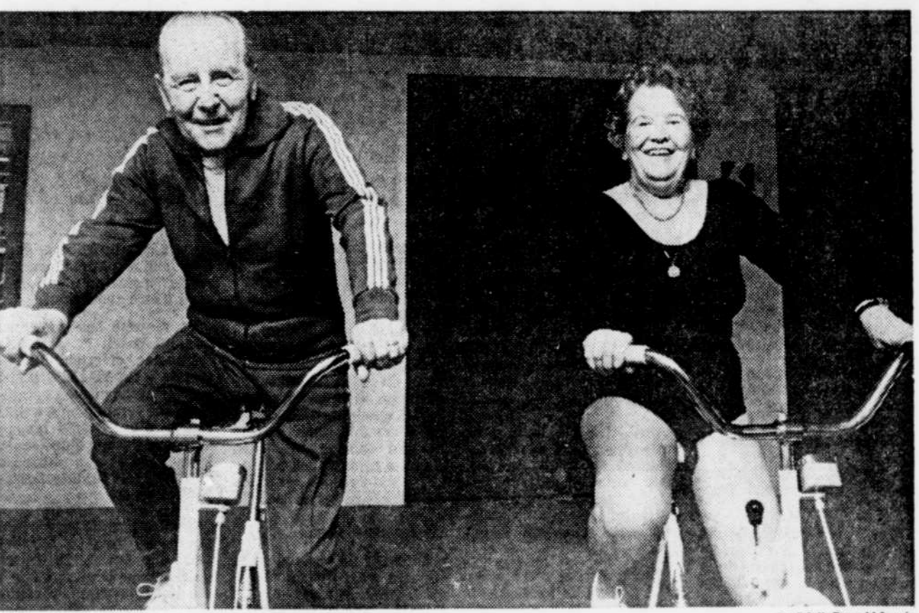
Les Roberge sont jeunes de cœur et entendent bien le demeurer. Le conditionnement physique tient une place primordiale dans leur vie. Ils sont en belle forme, ce qui leur permet d'occuper pleinement leurs heures de loisirs.

Au fait, depuis plus de deux ans qu'ils participent à des sessions de conditionnement physique, les Roberge n'ont encore jamais subi une seule restriction à leur dossier. L'examen médical semestriel est toujours satisfaisant et ils en sont très fiers.