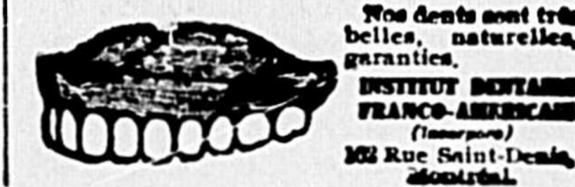
Nos dents sont très belles, naturelles, garanties, dentures dentaires FRANCO-AMÉRICAINES (Tous pays) 302 Rue Saint-Denis, Montréal.

Le lendemain, il n'avait pas encore quitté l'Hôtel-Dieu, où on l'avait transporté aussitôt.