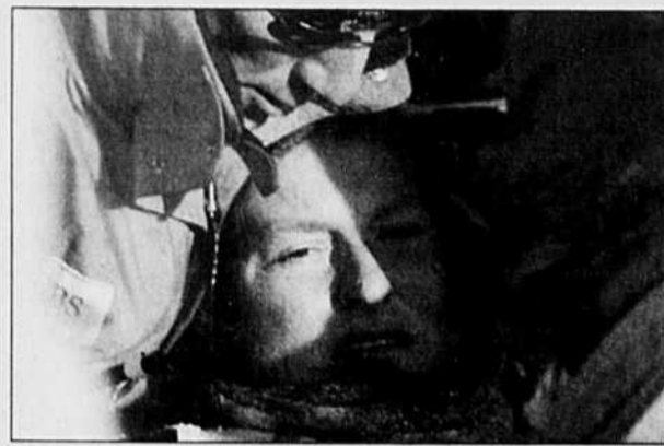
ANDREAS MEIER REUTERS

Stevens a sauvé les Devils pendant une punition à Krzysztof Oliwa à la troisième période lorsqu'il a empêché Zubrus, de lancer dans un filet grand ouvert.