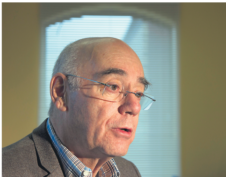
Jacques Daoust, nouveau ministre de l'Économie, est conscient qu'apporter des changements aux politiques d'aide aux entreprises pourrait créer des remous.

tirer sur les fleurs pour essayer de les faire pousser, a ironisé le ministre. Malheureusement, le Québec n'obtient pas vraiment de meilleurs résultats que les autres juridictions.»