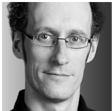
FRANCIS VAILLES CHRONIQUE

Les fonctionnaires ont tellement travaillé que le gouvernement du Québec a maintenant de sérieux problèmes. Pardon ?