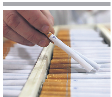
Reynolds, numéro deux américain du secteur du tabac, avalerait Lorillard, numéro trois.