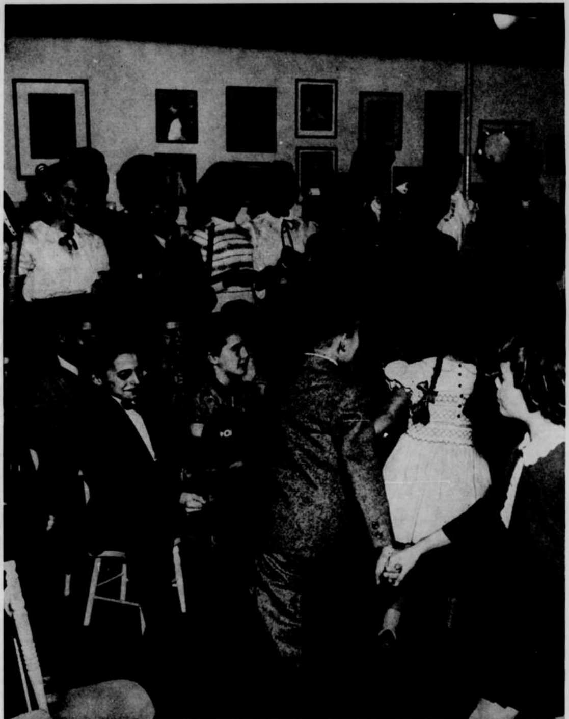
Dansons la Capucine...

Les Ondes Infantines apportent la preuve que les enfants s'amuse surtout entre eux, les uns devant le micro, les autres devant leur poste de radio. Les jeux enfantins ne perdent pas leur spontanéité pour avoir été réalisés en studio. Et le microphone, qui glace pourtant plus d'un artiste chevronné, n'intimide pas les jeunes. Aussi, il n'est pas rare de voir une blondinette, pas plus haute que trois pommes, mais qui a déjà l'habitude du public, lui faire une belle révérence, une fois son morceau fini.