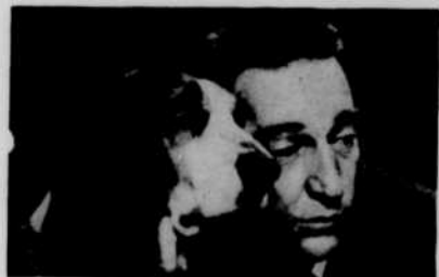
GARRY MOORE (... à droite)