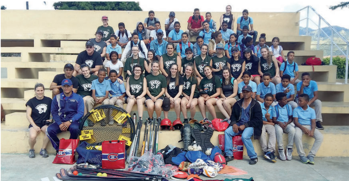
Les élèves du groupe de la PDM, quelques élèves de l'école Irma Brito, de San José de Ocoa, et leur enseignant en éducation physique, lors de la remise officielle du matériel sportif.

Les responsables du projet humanitaire de la polyvalente Deux-Montagnes (PDM),