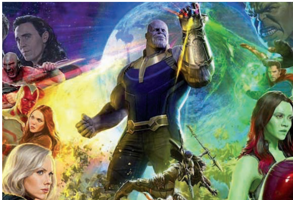
Plusieurs super héros vont affronter le diabolique Thanos.

Cela fait dix ans que les amateurs de l'univers cinématique de Marvel (MCU) attendent ce jour. Il aura fallu dix-huit films, et des milliards de dollars pour y arriver. Le long métrage est un phénomène en soi, simplement par la présence de plusieurs dizaines de super héros à l'écran.