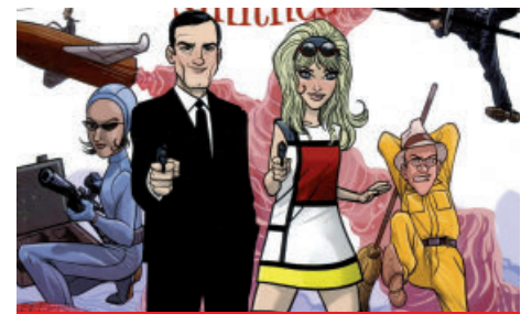
MacGuffin et Alan Smithee: Mission Expo 67 (Perro Éditeur)

Texte par Geneviève Gagnon Julie Lachance 514 714-2926