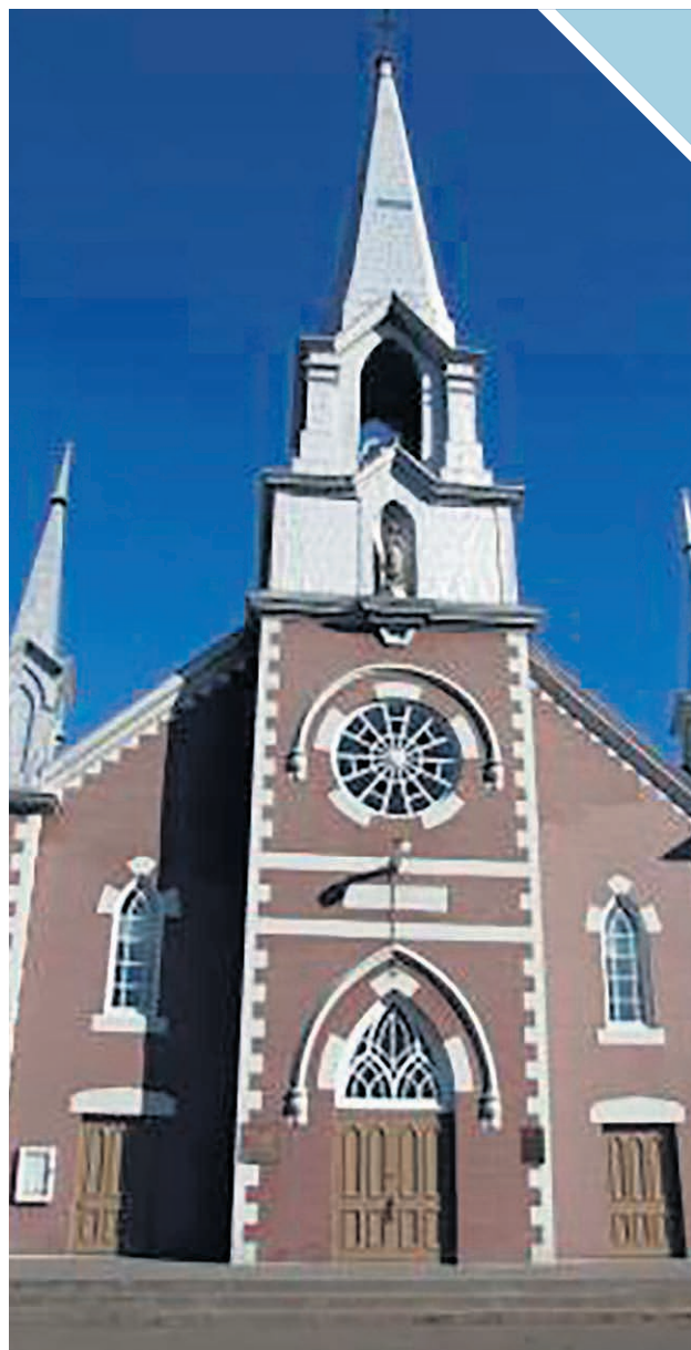
Le dimanche 24 décembre prochain, les citoyens sont cordialement invités à faire revivre la féerie des Fêtes à l'église de l'Île Dupas pour la grande messe de minuit.

Cette formule tant attendue a remporté un franc succès au cours des éditions passées, les précédentes salles comblées témoignant de cette évidence. Cet événement ouvre grand les portes de la sympathique église de l'Île Dupas à tous les amateurs de chants traditionnels de Noël, de messes au goût d'autrefois, de rassemblements fraternels et de recueils.