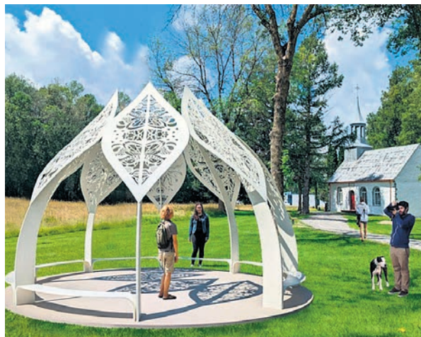
La Corporation est à la recherche de deux artistes offrant chacun un projet d'installation qui viendrait dynamiser le site de la Chapelle des Cuthbert.

La CpB reçoit le soutien financier du ministère de la Culture et des Communications et la Chapelle des Cuthbert est sous la responsabilité immobilière de la Société de développement des entreprises culturelles. (EB)