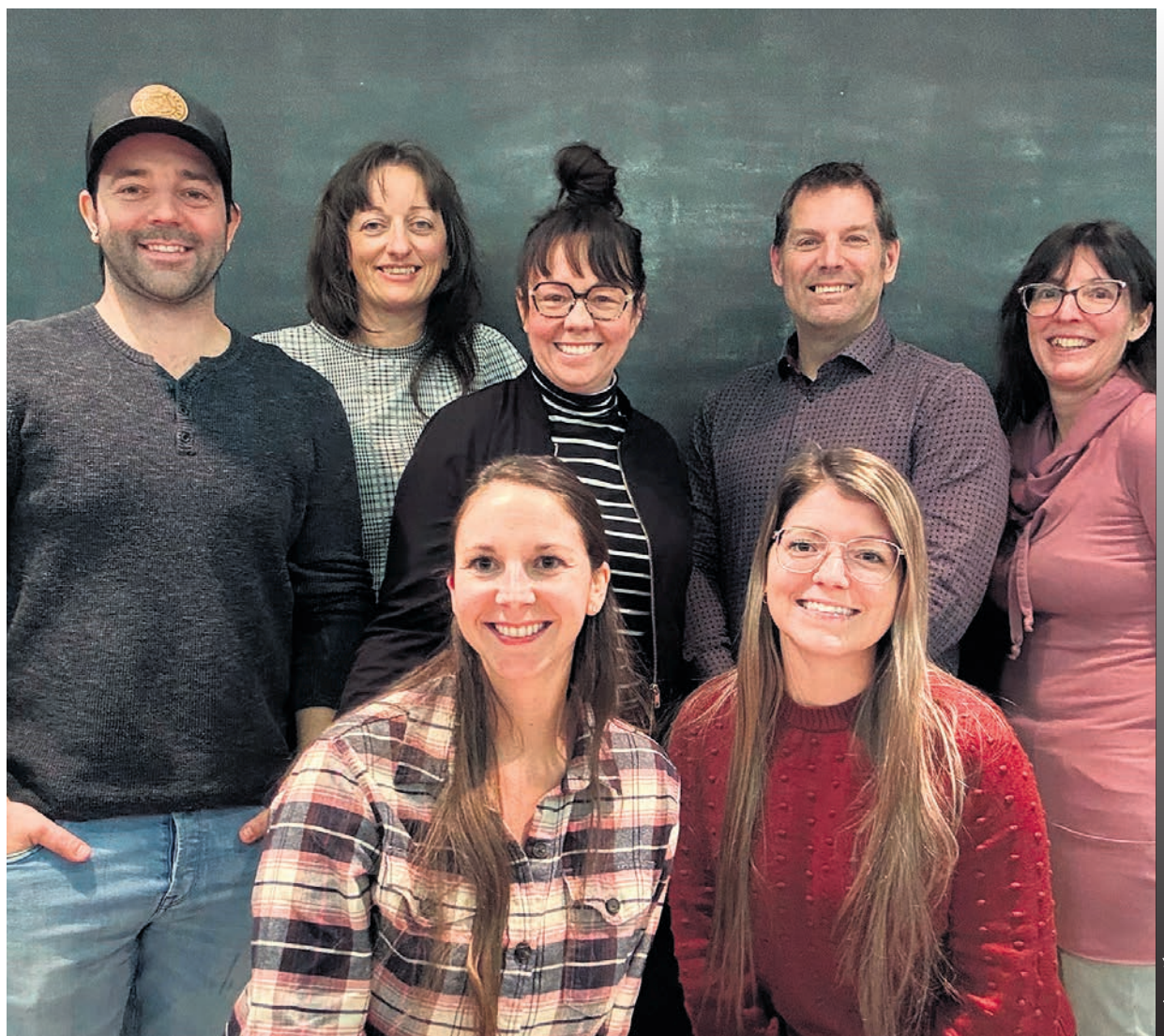
Le nouveau conseil d'administration du Festitrad.

Le Festitrad a pour mission de promouvoir les différentes musiques du monde ainsi que l'ensemble du patrimoine vivant québécois. (EB)