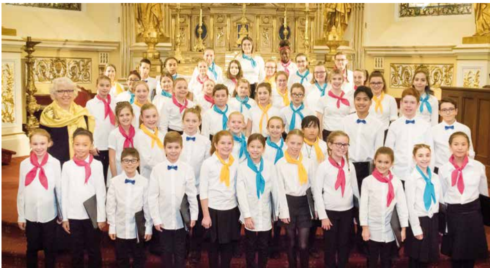
Les Petits Chanteurs de Beauport sont régulièrement invités à partager la scène avec d'autres artistes.

Les billets pour ce concert de 90 minutes avec Qw4rtz sont disponibles au coût de 25$ pour les adultes et 10$ pour les 17 ans et moins à l'École de musique des Cascades, en communiquant au 418 821-0727 ou par courriel à lespetitschanteursdebeauport@hotmail.com. ●