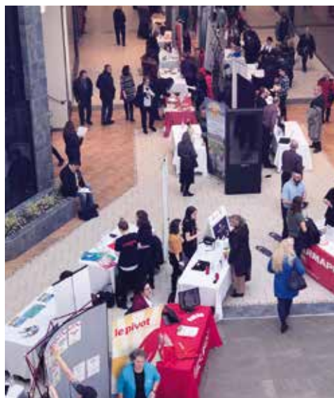
La 15 e édition a permis à 60 entreprises de proposer du travail dans divers domaines à plus de 800 chercheurs d'emplois en six heures aux Promenades Beauport.

Comme par les années précédentes, le Bureau de Services Québec de Beauport et le Carrefour jeunesse-emploi Montmorency (CJEM) se sont unis à nouveau pour organiser cet événement qui représentait une excellente occasion d'avoir un contact privilégié et de proximité avec les employeurs et de connaître les différents