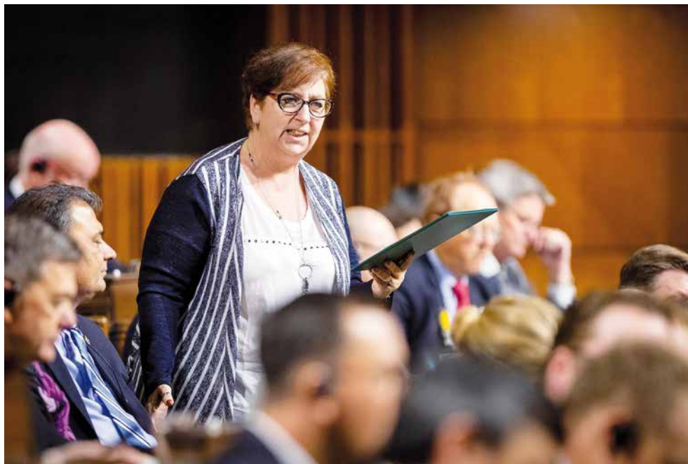
La députée de Beauport—Côte-de-Beaupré—Île d'Orléans—Charlevoix, Sylvie Boucher.

nière a avoué n'avoir pas eu le temps de le lire en intégralité. Toutefois, elle a constaté, sur le terrain, que la population semble satisfaite. « C'est sûr que je planifie de lire le budget caquiste avec attention » conclut la députée. ●