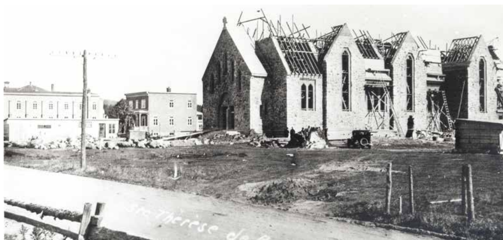
Photo de la construction du sanctuaire de Sainte-Thérèse de l'Enfant-Jésus en 1936, première église de style d'architecture Dom Bellot au Canada, qui fera partie de l'exposition itinérante parrainée par les Chevaliers de Colomb conseil 8098 de Lisieux.

L'Arrondissement de Beauport voulait ainsi stimuler l'essor de projets culturels permettant une vitalité culturelle accrue, une participation des citoyens et une stimulation du sentiment d'appartenance. Tous les projets subventionnés dépassent le simple divertissement et présentent un volet de sensibilisation, d'animation, d'éducation artistique ou de médiation culturelle. ●