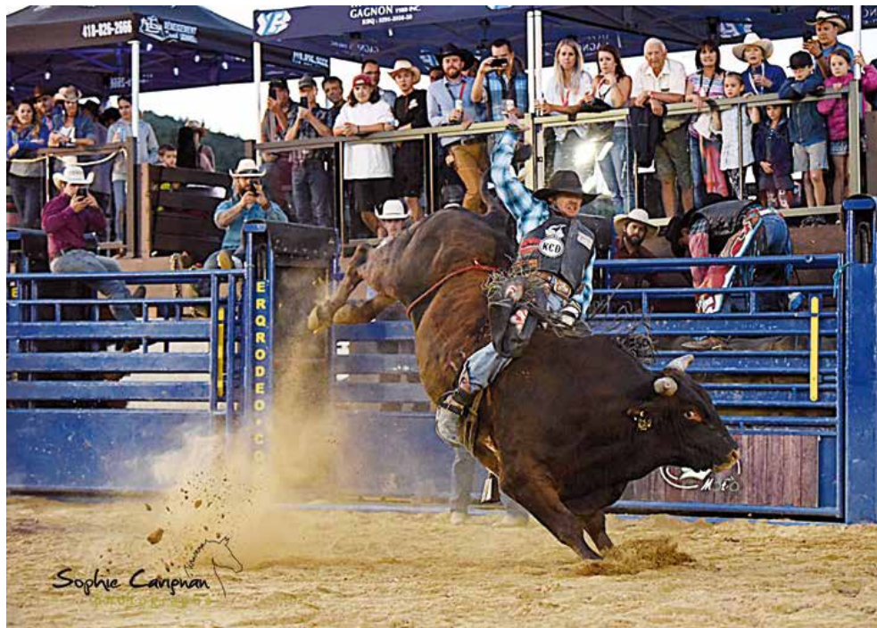
Les amateurs de sensations fortes seront servis à souhait encore cette année.

Le président a ajouté du même souffle que l'offre alimentaire sera plus alléchante et que la Place de la famille sera rehaussée. Finalement, la danse country sera de nouveau à l'honneur. Plus de 14 écoles de danse de partout en province viendront rythmer la fin de semaine pendant le danse-o-thon qui devrait durer une trentaine d'heures. ●