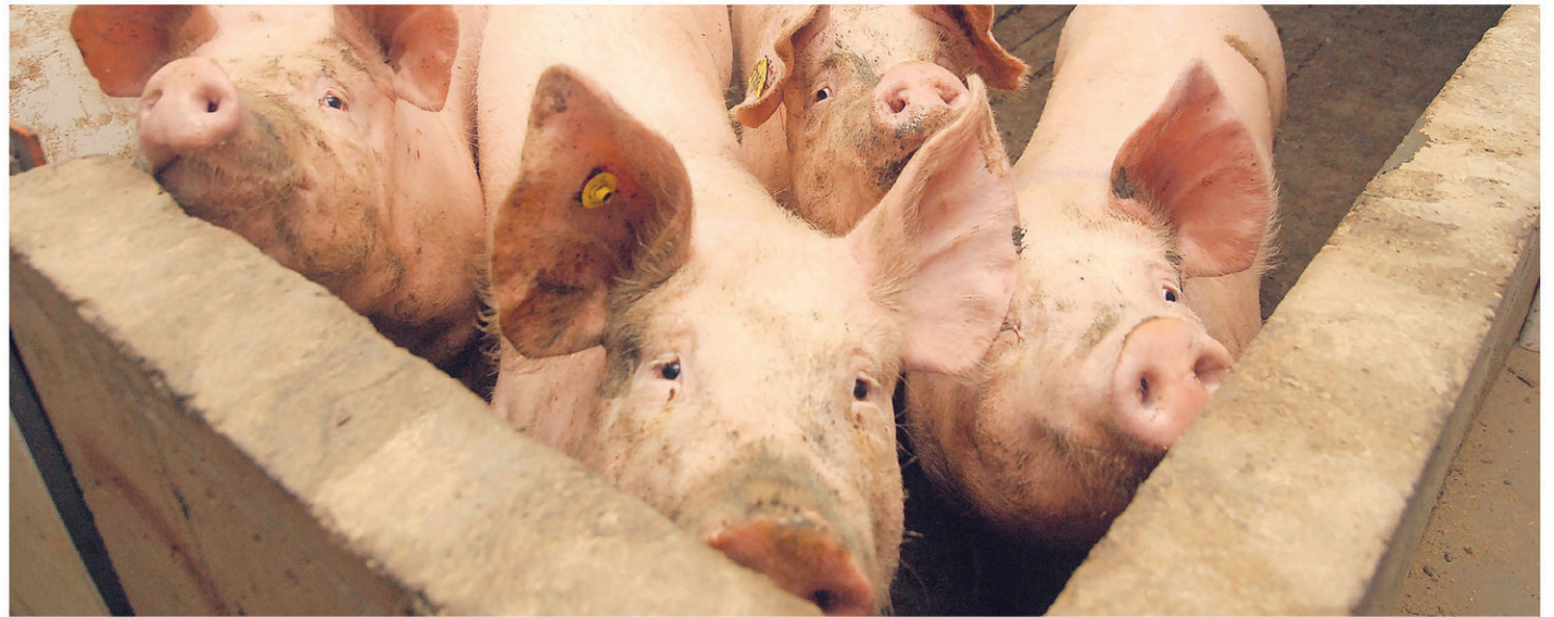
Les Chinois importent beaucoup d'abats porcins, un fait rare à l'international.

« Ça a provoqué un effet domino sur les ventes internationales. Les abattoirs américains fonctionnaient à pleine capacité. Le prix offert aux producteurs d'ici par nos abattoirs avait chuté de moitié,