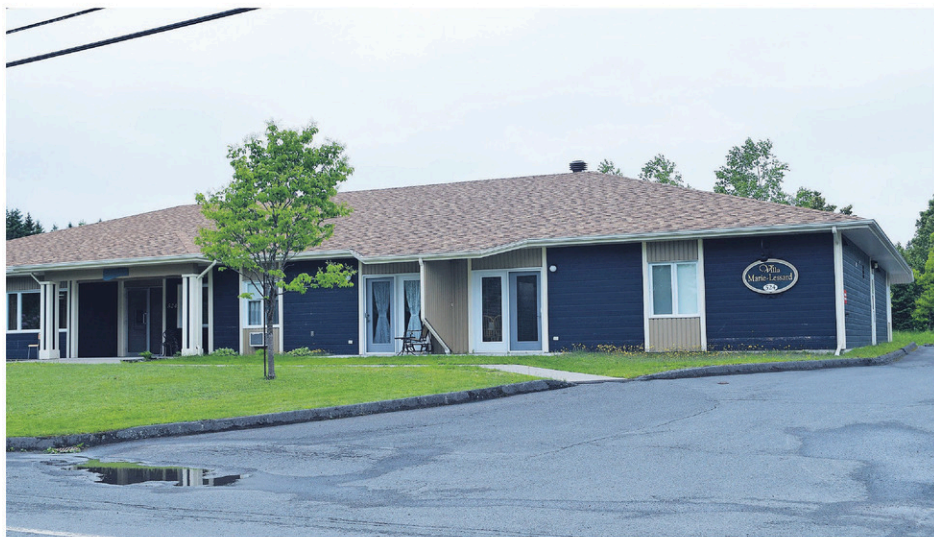
La Villa Marie-Lessard de Lac-Etchemin est l'une des deux résidences opérées par Le Tremplin.

La négociation fut très rapide dans ce dossier, l'accréditation syndicale ayant été accordée il y a tout juste cinq mois. Les syndiqués avaient approuvé, à 100 % en assemblée générale le 14 juin dernier, l'entente de principe intervenue avec leur employeur.