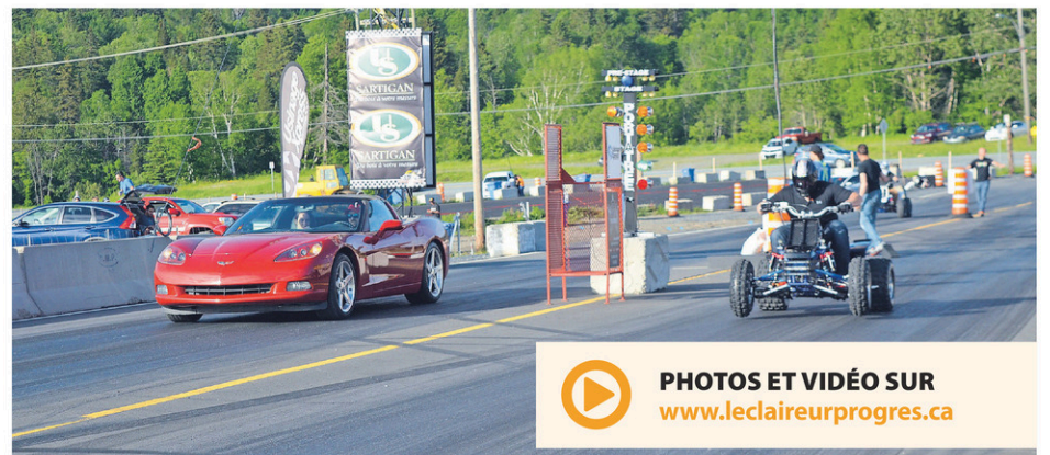
Une Corvette qui affronte un VTT à la course ? C'est possible aux Vendredis Drags!