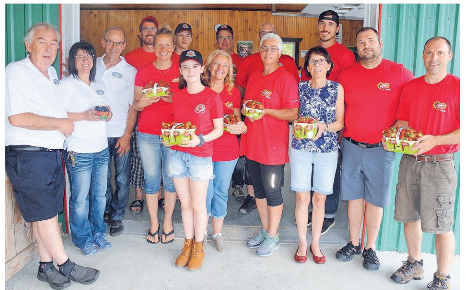
Les producteurs de Chaudière-Appalaches sont fin prêts à vous offrir des fruits délicieux.

Les producteurs vous invitent à prendre le temps de profiter de l'été avec une sortie à l'autocueillette. Le répertoire des sites est disponible au lesfraichesduquebec.com . (A.B.)