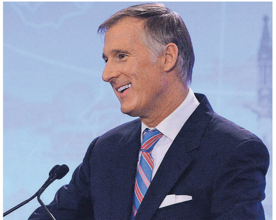
Maxime Bernier croit en sa réélection et à l'arrivée de plusieurs députés du PPC à la Chambre des communes.

Durant la saison estivale, Maxime Bernier