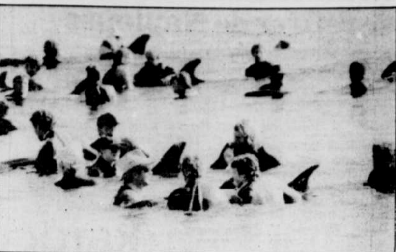
Des volontaires australiens guidaient ainsi vers le large des baleines qui s'étaient échouées mardi matin.