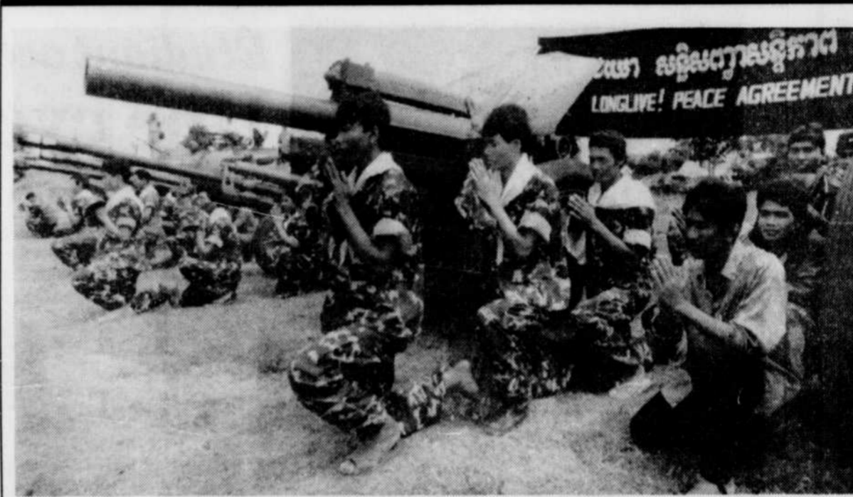
Des soldats des Forces de libération armée nationale du peuple Kmer participent à une cérémonie de prière, dans un camp situé à 400 kilomètres de la capitale du Cambodge.

Déjà, les services de Doppelmeyer ont été retenus pour construire les remontées mécaniques. L'enneigement artificiel serait confié à Turbo Crystal.