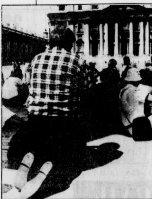
Devant la basilique Saint-Pierre de Rome, plusieurs fidèles ont prié pour Jean-Paul II.