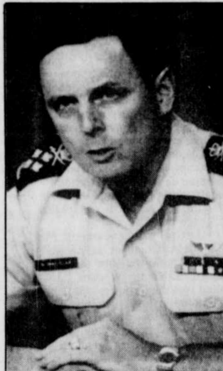
Le général John DE CHASTELAIN

Le général a rendu visite aux Canadiens dans la capitale bosniaque assiégée, la