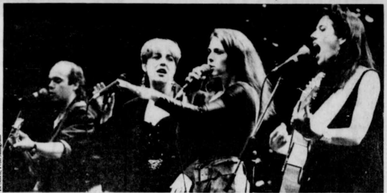
Le groupe Hart Rouge en... rang d'oignons

Non, ils ne sont pas mauvais, les Campagne. Ils aiment la musique ; ça se sent. Mais il leur manque un petit quelque chose, un je-ne-sais-quoi qui permettrait au groupe d'accrocher encore davantage. Ce qui n'a pas diminué l'envie du public de leur réclamer un rappel ; généreux, Hart Rouge a interprété non pas une mais deux chansons, dont (a cappella) Mon pays , de Claude Léveillée.