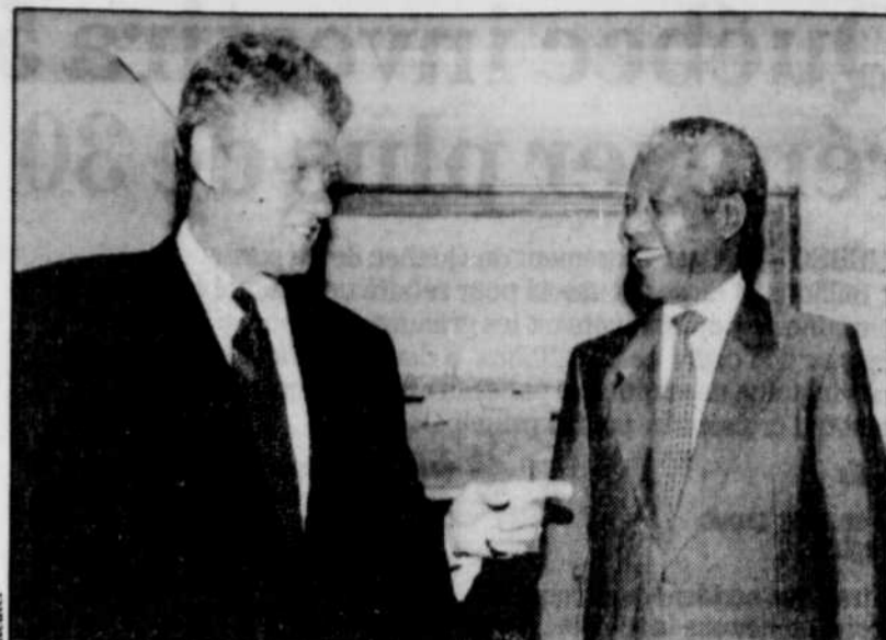
Les deux vedettes politiques de la journée à New York, le leader démocrate Bill Clinton et celui de la majorité noire sud-africaine, Nelson Mandela, s'étaient donné rendez-vous hier à l'hôtel de Clinton. Mandela a dit qu'il ne se mêlerait pas de l'élection présidentielle américaine du 3 novembre.

M. Mandela a réaffirmé la volonté de son mouvement de maintenir son «engagement dans le processus de négociations» pour une Afrique du Sud démocratique, malgré le retrait de l'ANC des pourparlers avec le gouvernement après le massacre du 17 juin à Boipatong (45 morts), près de Johannesburg.