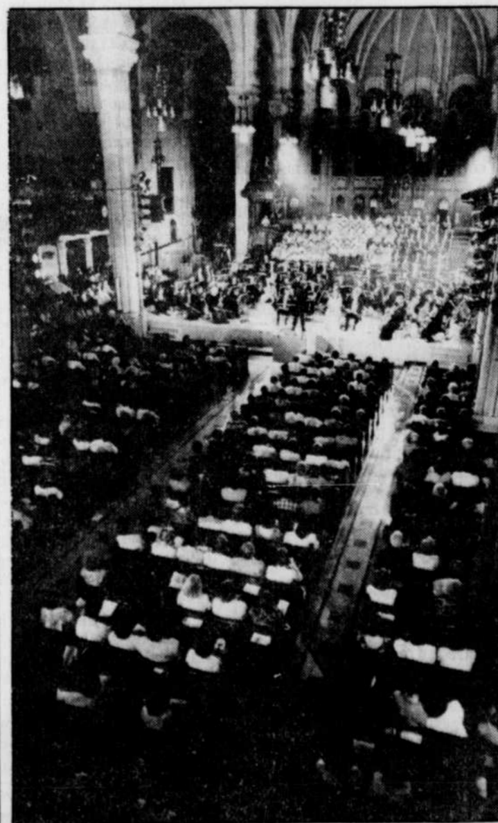
La foule a envahi l'église Saint-Roch pour cette première canadienne. Représentation impressionnante, notamment quand la scène a été envahie par une « fumée » artificielle.