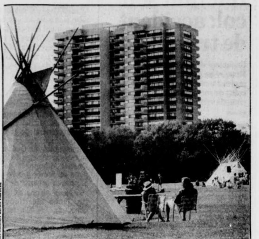
Il n'y a pas foule à la Conférence mondiale des jeunes indigènes, sur les Plaines d'Abraham. Les organisateurs de l'événement attendaient 1500 participants, mais on n'en compte jusqu'à maintenant qu'environ 200, dont bon nombre de Cris.

vacances en France, il fera alors ses premiers commentaires substantiels sur les derniers développements constitutionnels.