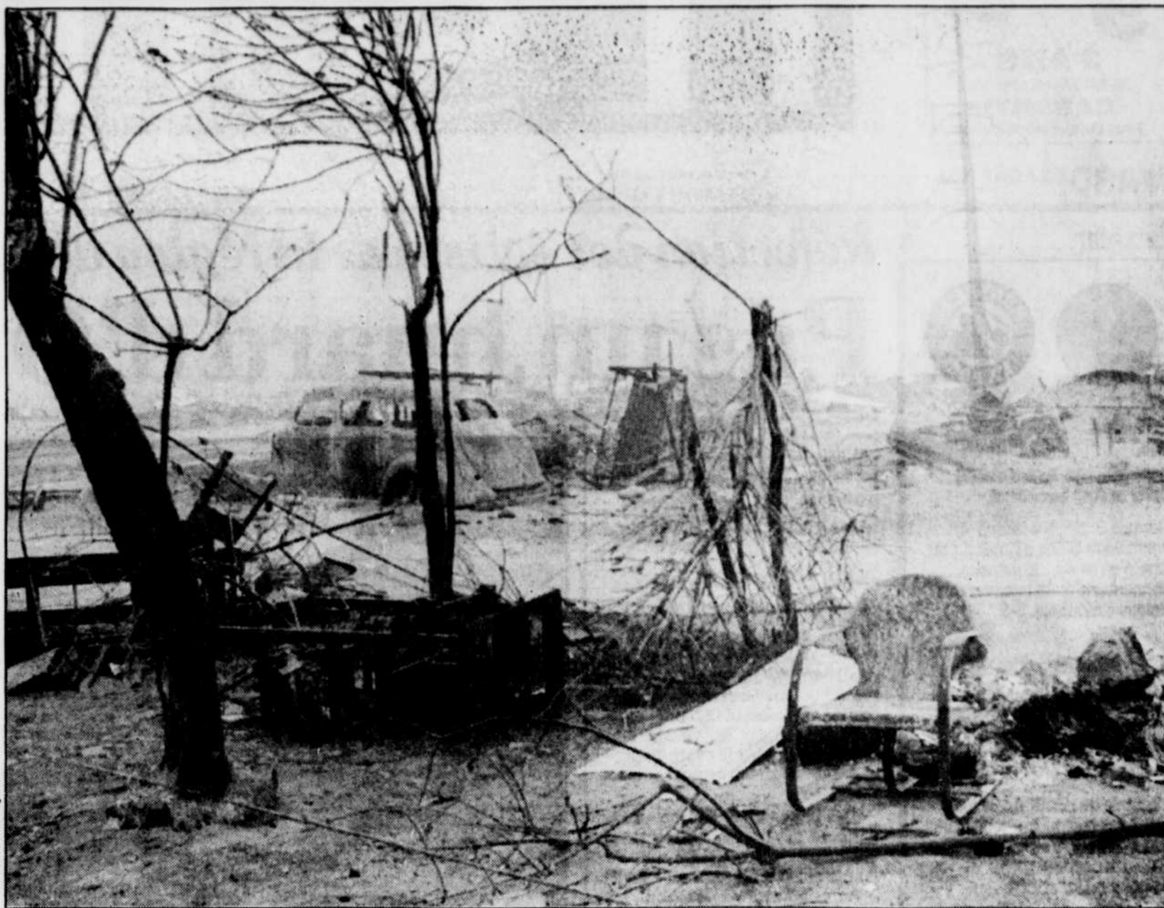
Avec une violence inouïe, le feu est en train de raser plusieurs hectares de forêt dans l'Ouest américain. Dans le secteur de Leavenworth (État de Washington) des milliers de citoyens ont déjà été évacués et plusieurs autres sont sur un pied d'alerte.

Mais au-delà de la réglementation, le civisme des plaisanciers est souvent en cause lors de pareils incidents. « Ce sont des adultes qui achètent ces machines-là et qui mettent leurs enfants dessus, dit M. Simard. On essaie d'enseigner les règles de sécurité aux citoyens, mais qu'est-ce qu'on peut faire s'ils ne les appliquent pas ? Tant que le provincial n'aura pas une loi avec des dents, il n'y aura pas grand-chose à faire ».