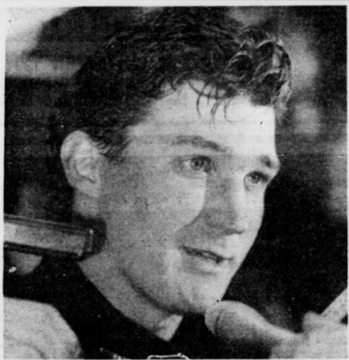
Mario Lemieux a manqué au moins 25 matchs à chacune des cinq dernières saisons en raison de douleurs dorsales et de la maladie de Hodgkin.