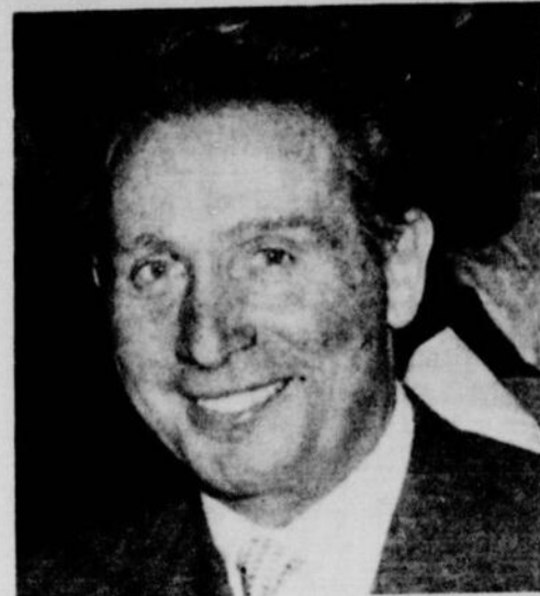
Charles Trenet a déjà fait les beaux soirs des grandes salles de cabaret de Montréal. Ci-dessus, au cours de l'un de ses nombreux séjours dans nos parages.

Sa simplicité, son charme, son visage rondlet faisant miroiter des yeux vifs, grands et intelligents, tout confère à Trenet une allure de grand seigneur de la chanson. Il est de la classe de ceux qui ne meurent jamais.