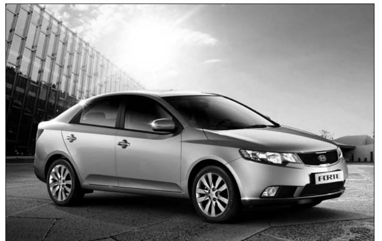
La Kia Forte 2010 qui remplacera l'actuelle Spectra...