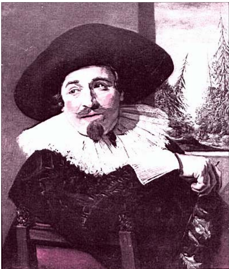
Portrait de M. Massa. Tableau de Franz Halz, La musique comme point de départ à un développement personnel.

Les spectateurs ont pour une fois été généreux en applaudissement autant pour les chanteurs et le chef d'orchestre que pour l'orchestre lui-même. Il faut dire que cette messe de Bach ainsi que son interprétation ont vraiment communiqué une joie de vivre que l'on conserve bien après le spectacle.