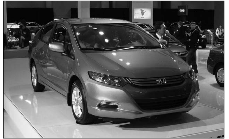
La voiture hybride la moins chère (quand elle sera commercialisée plus tard cette année), la toute nouvelle Honda Insight 2010

La visite du Salon de l'Auto de Montréal était somme toute assez plaisante, mais pas très excitante : trop de nouveautés présentées à Détroit étaient absentes à Montréal. En vrai, j'ai trouvé beaucoup plus excitante l'existence d'un tunnel souterrain reliant le pavillon Roger-Gaudry au pavillon Decelles. Voilà un secret bien gardé! Y accéder à partir du pavillon Decelles est quand même compliqué (d'abord, il faut se rendre au 3200 Louis-Colin, entrer dans le