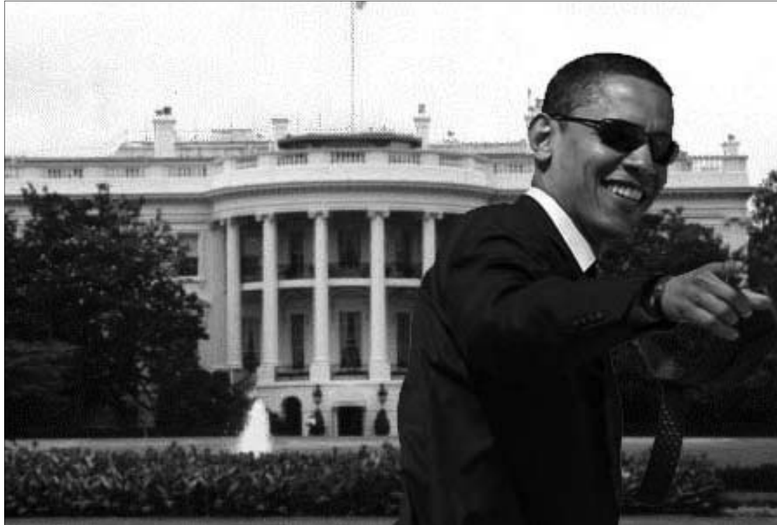
Il est pas cool ce Obama ? Un mix entre Neo (The Matrix) et Martin Luther King (dont c'est le jour lundi d'ailleurs). « Toi même tu sais... » qu'il semble nous dire l'amigo !

Nouvelle à la donne cependant, la crise actuelle au Moyen-Orient. Là, c'est une autre histoire. Il faut dire que depuis que celle-ci a commencé, la Maison Blanche joue un peu au fonctionnaire un vendredi après-midi précédant des vacances. On ne prend