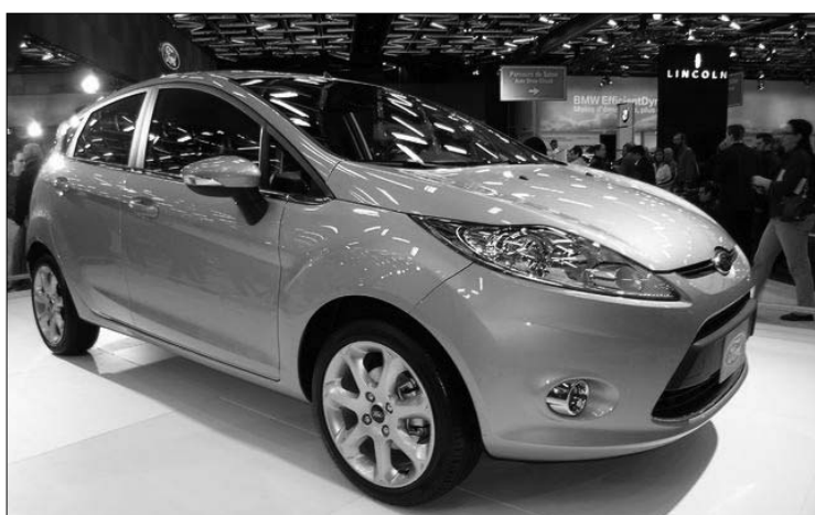
La version européenne de la Ford Fiesta, une voiture sous-compacte qui devrait arriver dans nos concessionnaires Ford dès l'année prochaine.