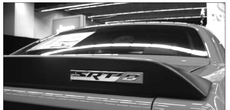
Gros plan sur l'aileron en plastique creux de la Dodge Challenger SRT-8