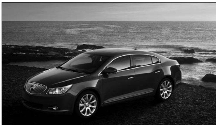
La très élégante Buick Lacrosse 2010 (renommée Allure au Canada).

pavillon Lionel-Groux, pour ensuite sortir vers le garage Louis-Colin où le tunnel débute), mais il est vraiment pratique: je n'ai plus à braver le froid intense lorsque je monte la colline de l'Université de Montréal pour me rendre à Polytechnique!