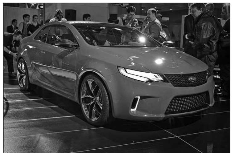
Et la Kia Koup (nom de prototype), un coupé sport dérivé de la Forte.