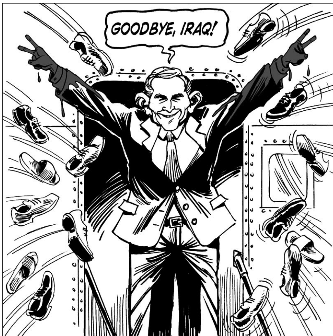
George W. Bush a définitivement quitté la Maison Blanche et est rentré dans son cher Texas mardi après avoir entendu son successeur Barack Obama prêter serment et appeler à «rebâtir l'Amérique» qu'il lui laissait.

Oui, il emmerde Obama. Il est surtout emmerdé par Obama. Et