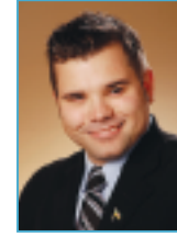
MATHIEU GRAVEL communications