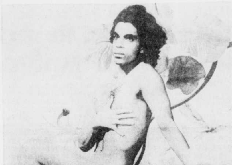
La fameuse pochette du dernier disque de Prince.

Prince vient d'entreprendre à Paris une tournée en Europe qui se poursuivra jusqu'à la fin août. ♦