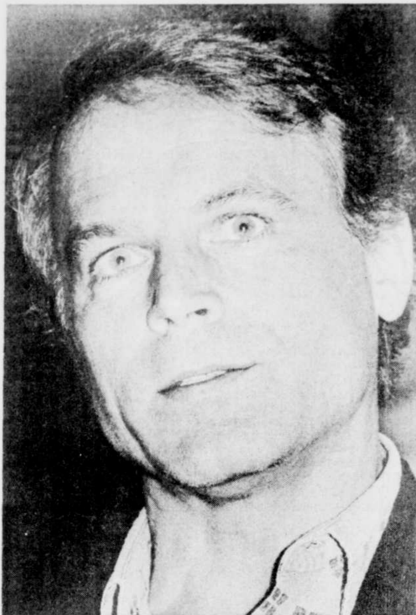
Terence Hill: «J'habite un village de 2.000 habitants, dans le Massachusetts. J'ai essayé de vivre à Los Angeles: je n'y suis resté que deux mois. Québec, c'est déjà trop grand!»

Terence Hill vient de produire un film qui n'est pas précisément violent, puisqu'il s'agit d'un remake de... Don Camillo. ♦