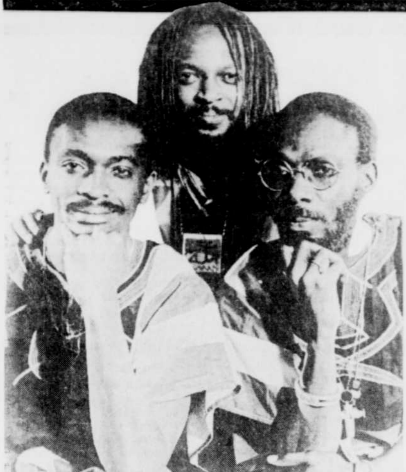
Les frères Touré Kunda, c'est d'abord cette musique africaine rythmée, profonde, enracinée.