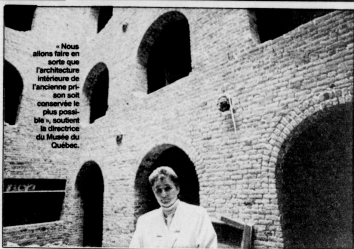
« Nous allons faire en sorte que l'architecture intérieure de l'ancienne prison soit conservée le plus possible », soutient la directrice du Musée du Québec.