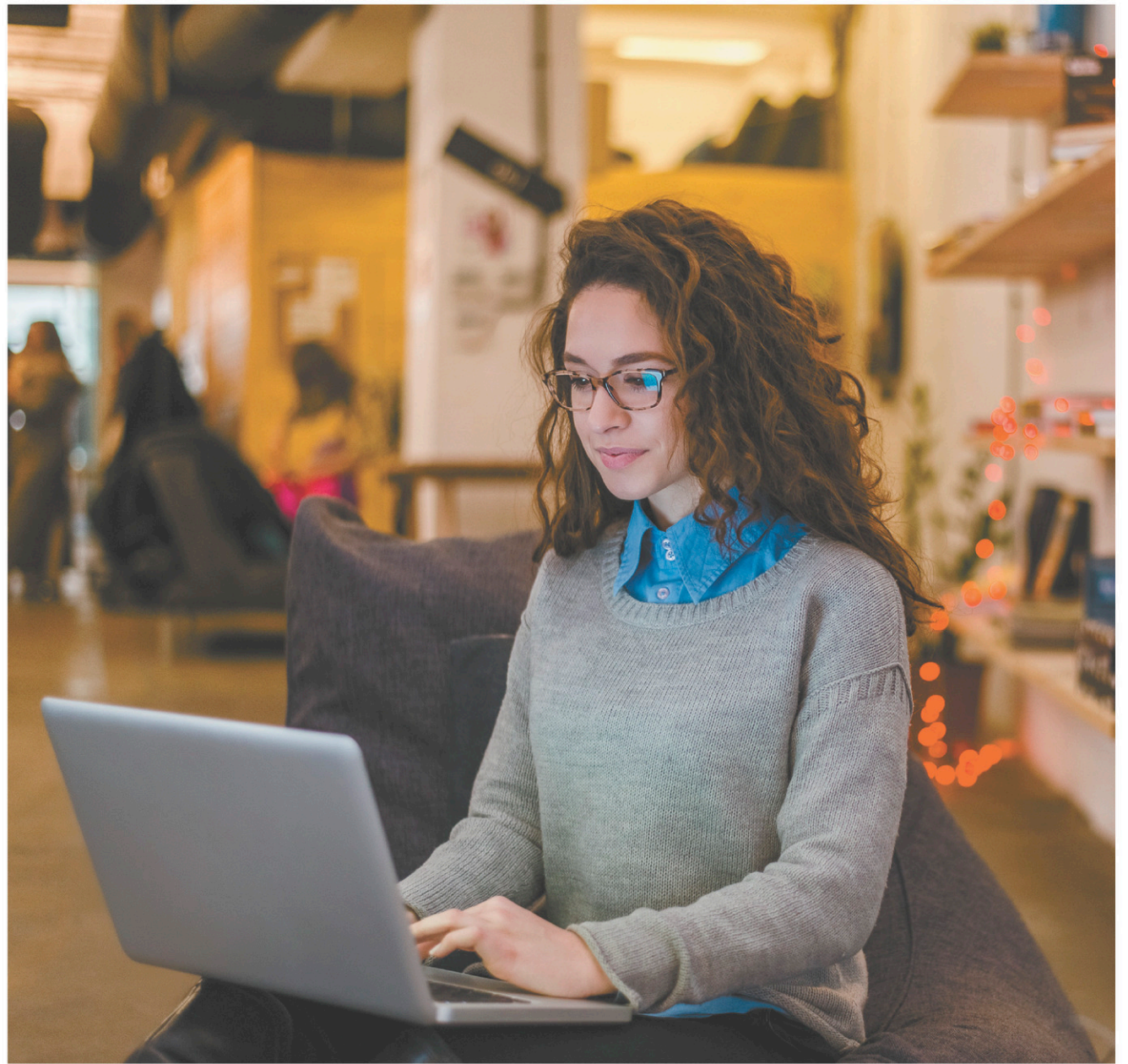
Au gouvernement, on juge que le Québec prend du retard dans l'offre de formation à distance.