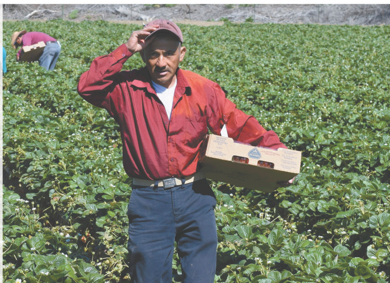
L'amélioration des conditions de travail faciliterait l'embauche de personnel en ces temps de pénurie de main-d'œuvre.

La transition énergétique à venir pourrait, en effet, entraîner un déclin de certains secteurs d'emploi. Ce sujet préoccupe la centrale, qui souhaite que s'effectue une transition juste. Le syndicat est aussi interpellé par la nécessité de réduire nos émissions de gaz à effet de serre. À ce chapitre, elle déplore le report par le gouvernement des cibles de réduction de ces gaz, malgré des investissements prévus dans le budget pour la lutte contre les changements climatiques. Elle invitait d'ailleurs la population à manifester le 27 avril pour l'avenir de la planète.