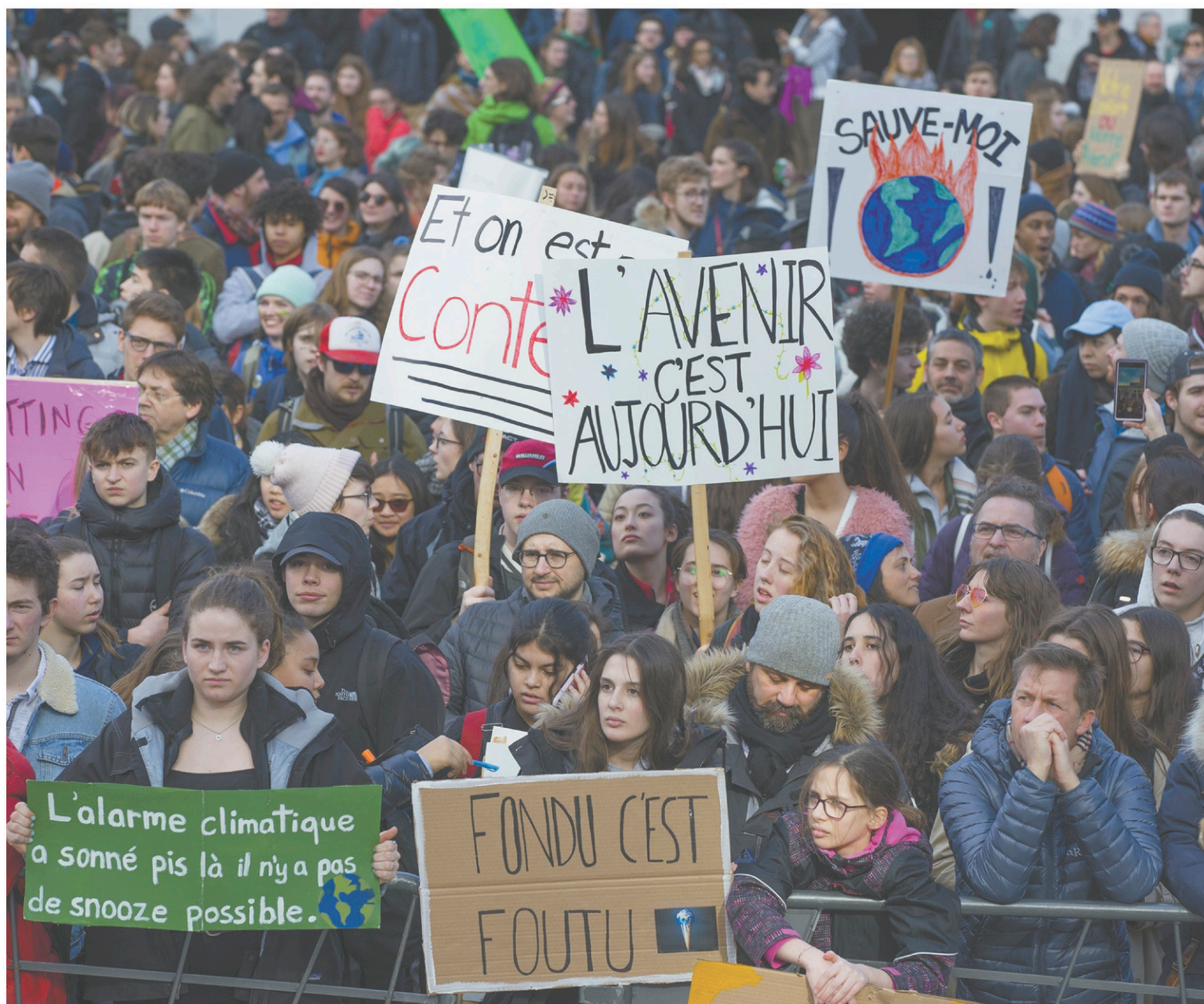
Alors que les manifestations pour le climat se multiplient aux quatre coins de la province, la FTQ appelle à un vrai débat sur les changements climatiques et l'exploitation des hydrocarbures.