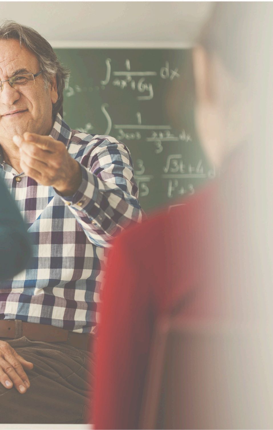
La valorisation de la profession d'enseignant passe en grande partie par le salaire, selon la Fédération autonome de l'enseignement.