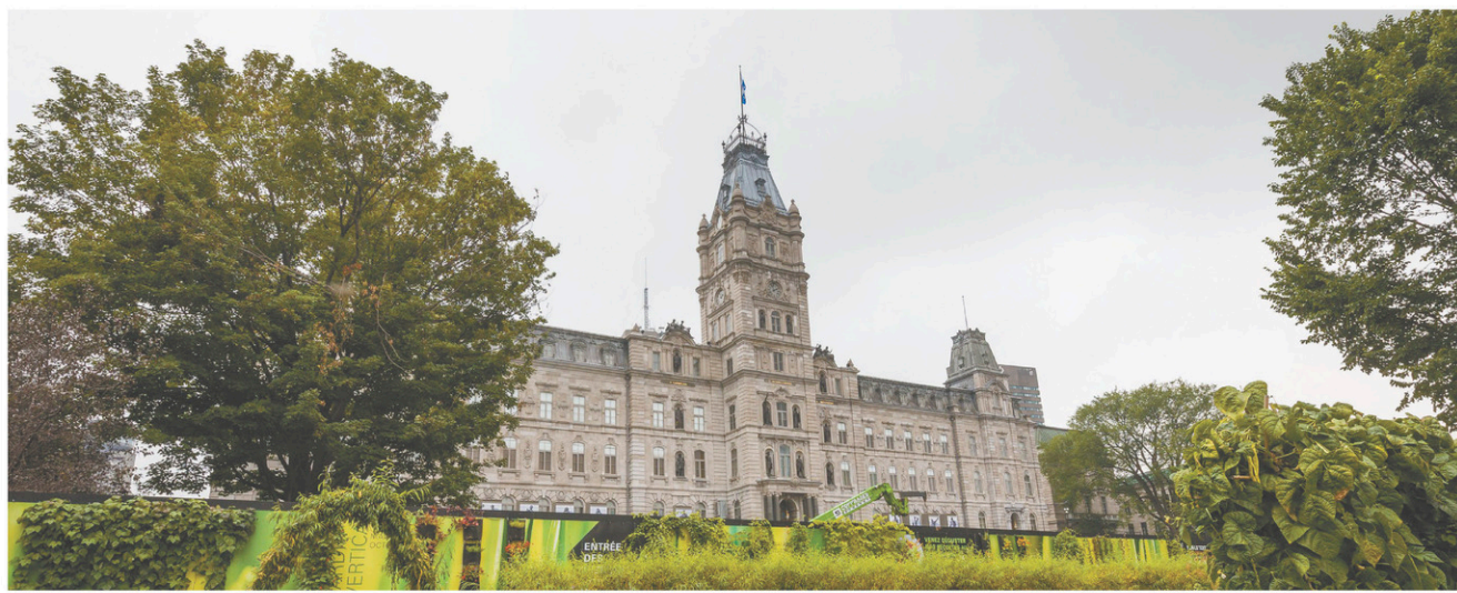
La pénurie de main-d'œuvre se fait sentir un peu partout au gouvernement.

« On a beaucoup de leçons à tirer du passé. Ça fait 40 ans que le secteur public négocie de la même façon. »