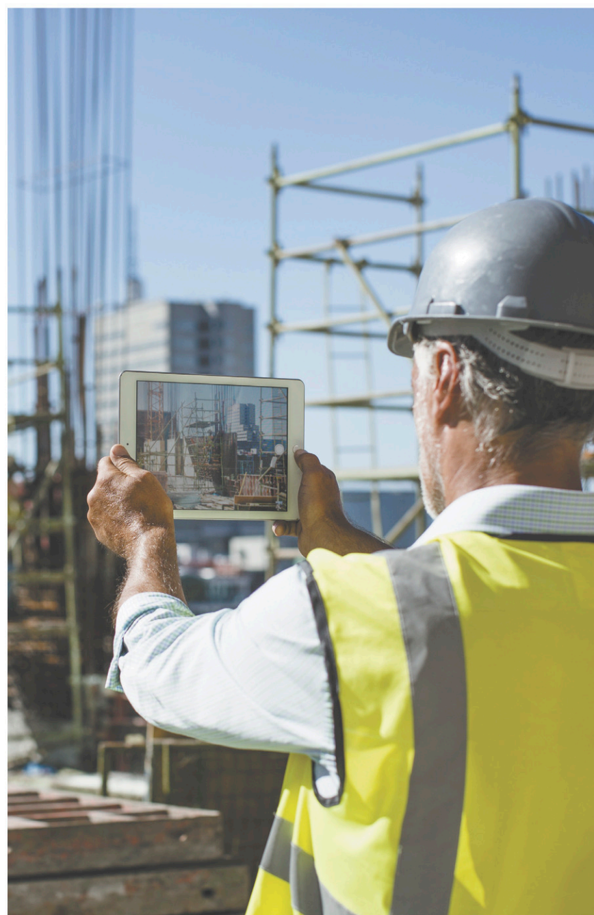
L'éducation et la formation ne sont plus confinées aux bancs d'école.