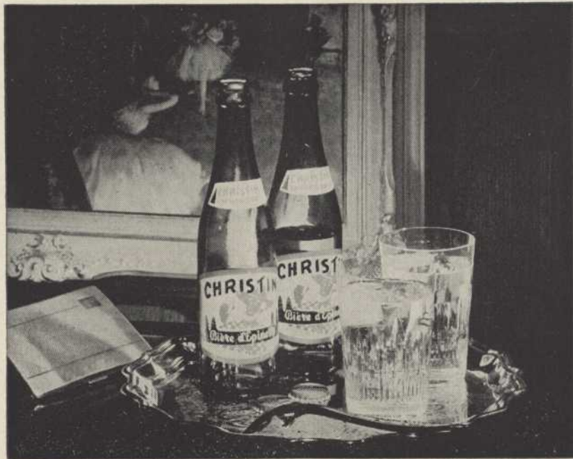
Toujours de bon goût