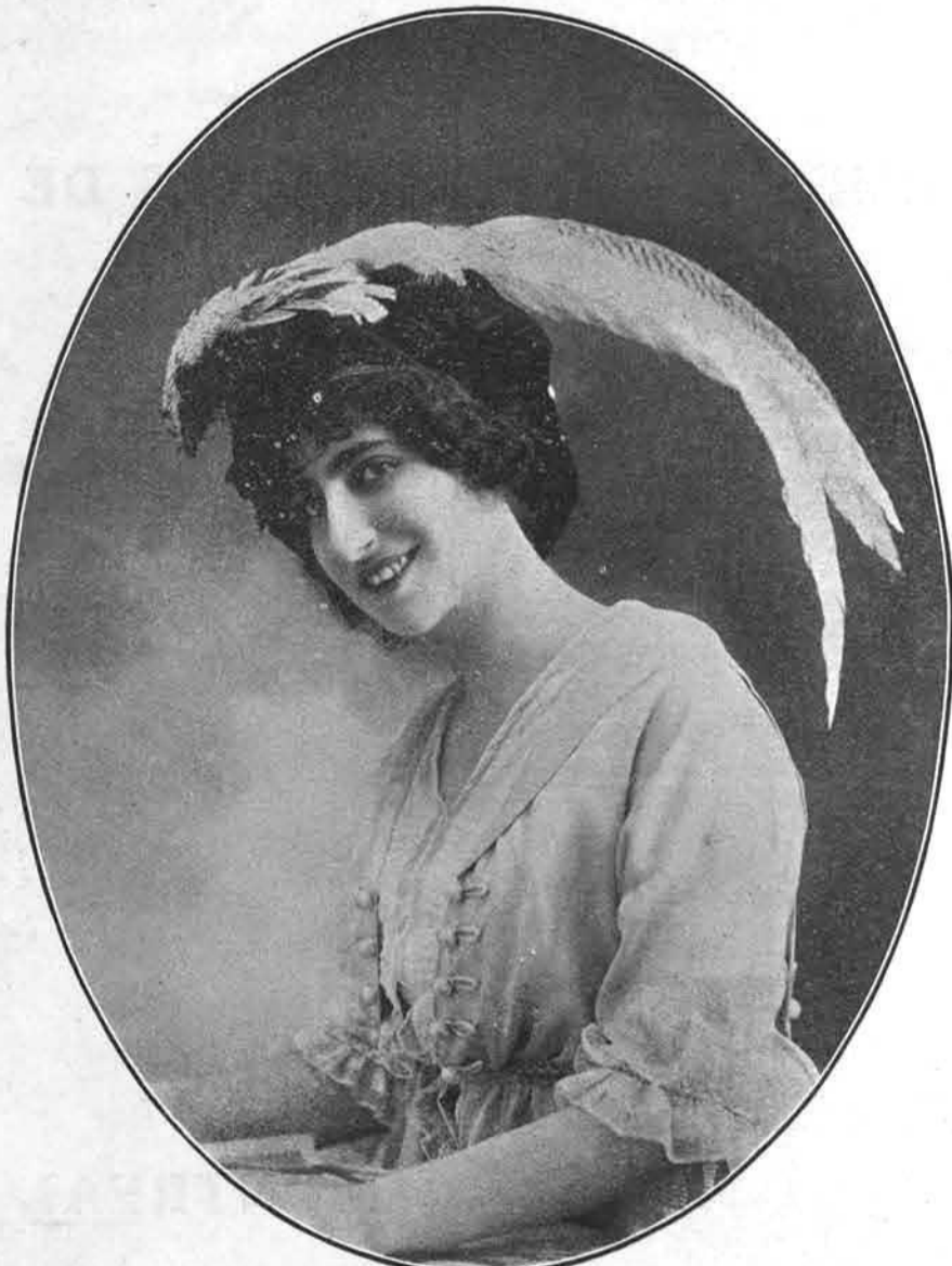
MELLE REAL DU THEATRE FRANÇAIS [Montréal]