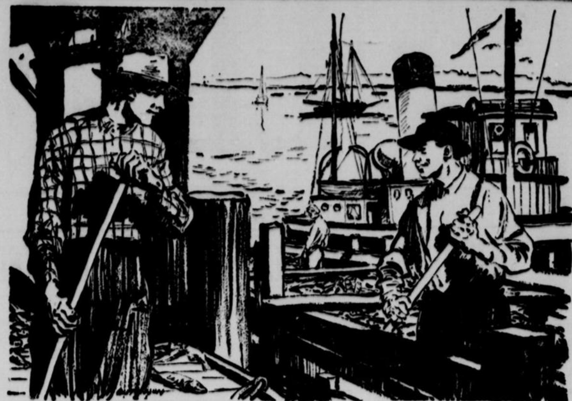
LES CANADIENS ET LEURS INDUSTRIES - ET LEUR BANQUE