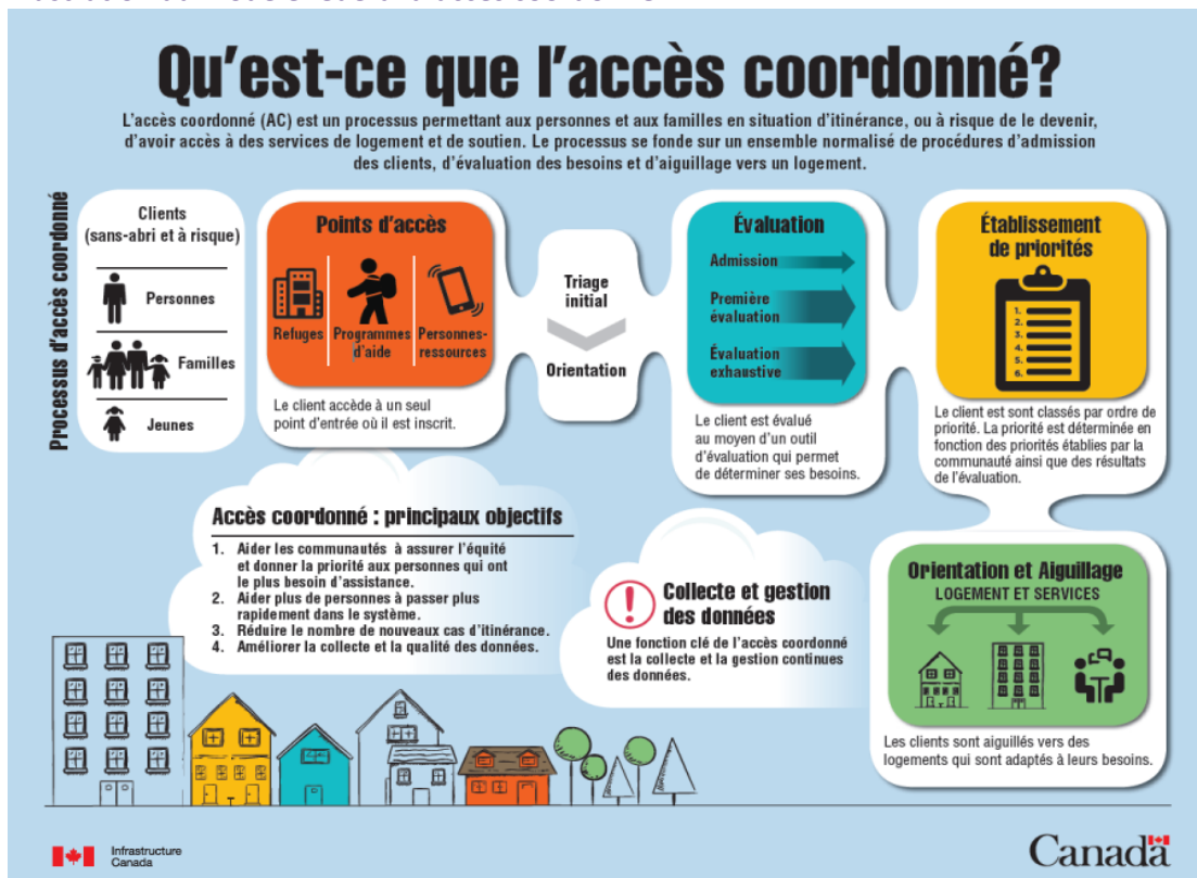
Illustration du modèle fédéral d'accès coordonné 2 .

Progressivement, la communauté désignée de Drummondville a défini son propre système d'accès coordonné selon le contexte local, incluant sa gouvernance, ses priorités et ses mécanismes de concertation communautaire ainsi que les outils et processus dont la communauté a besoin.