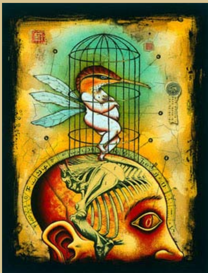
Illustration pour la couverture du Répertoire Illustration Québec © Pol Turgeon

Comment ça se passe pour toi, ces jours-ci, au Québec? Est-ce ici que tu trouves la plupart de tes clients?