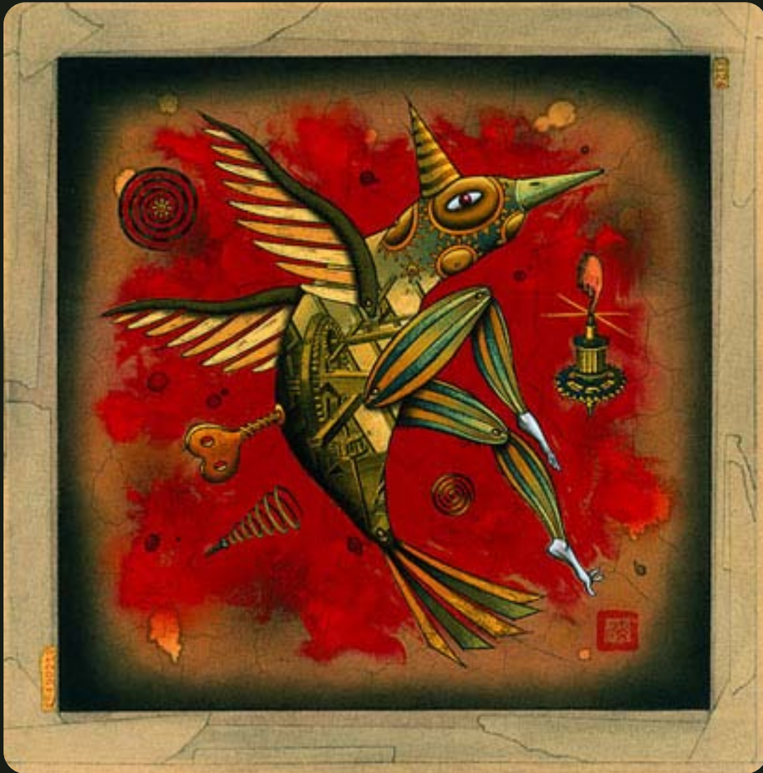
Illustration pour le programme d'automne du Joyce Theater / Rave Advertising © Pol Turgeon