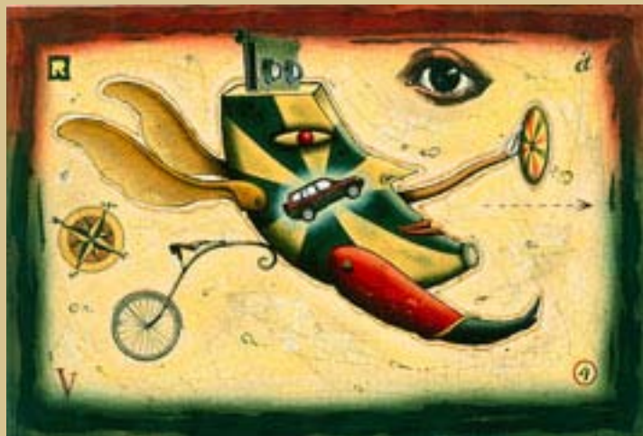
Publicité Toyota RAV 4, Saatchi & Saatchi © Pol Turgeon