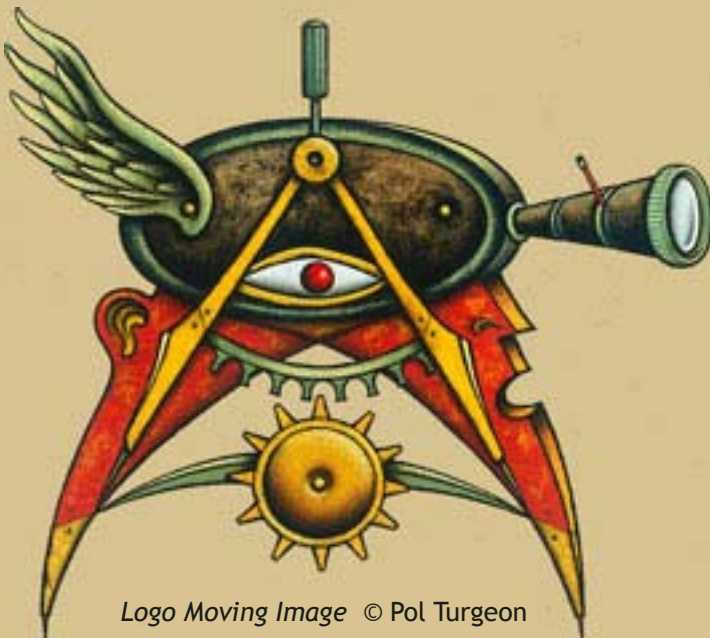
Logo Moving Image © Pol Turgeon

Oui, je fais plein de choses connexes à l'illustration (ou dérivées de) qui me passionnent au plus haut point. Faire ce livre a effectivement été très stimulant et a marqué un point tournant. Depuis, je fais de plus en plus d'expos. solo (j'en ai fait une en 2006 à Los Angeles et j'en ai une qui s'en vient à la fin de l'année à New-York à la Society of Illustrators ), je continue d'enseigner parce que j'aime beaucoup ça, même si c'est complètement débile comme boulot et très mal payé pour la quantité de travail (je suis chargé de cours...). Je donne aussi des conférences et des ateliers dans les écoles et universités. En ce moment, je travaille sur le visuel d'un show de danse. Ça fait pas mal de temps que j'avais envie de travailler sur un show et de penser en termes de spectacle