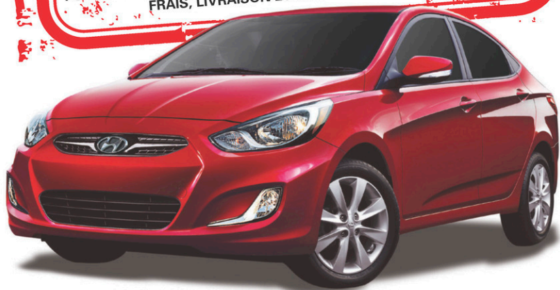
Modèle GLS 4 portes montré *

POUR ACHATS AU COMPTANT ET FINANCEMENT AU TAUX BRILLANT. FRAIS, LIVRAISON ET DESTINATION INCLUS.