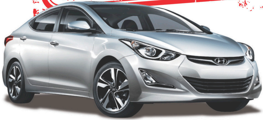
Modèle Limited montré*

POUR ACHATS AU COMPTANT ET FINANCEMENT AU TAUX BRILLANT. FRAIS, LIVRAISON ET DESTINATION INCLUS.