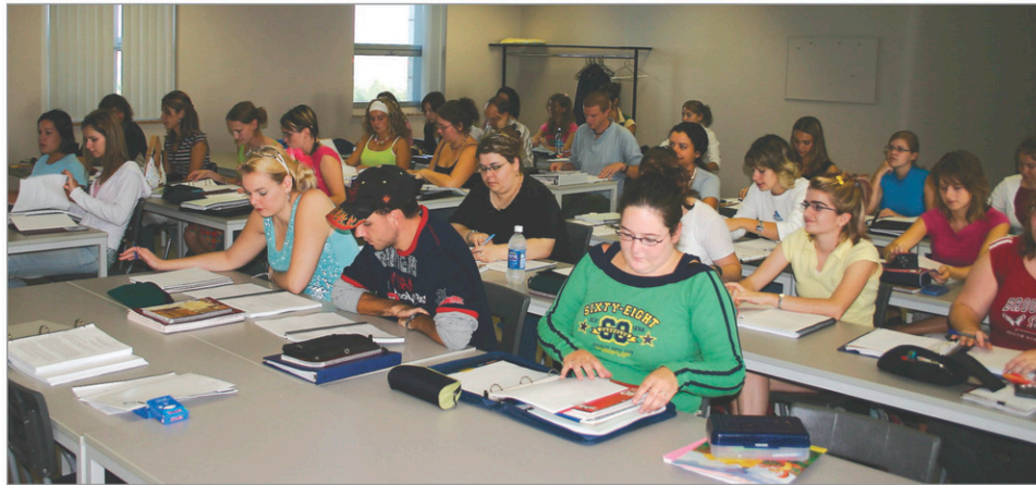
La CSBE doit faire des compressions de l'ordre de 2,9 M$, ce qui affectera les services aux élèves.

Une autre tuile vient de tomber sur la tête des commissions scolaires au Québec puisque pour parvenir à l'équilibre budgétaire, le gouvernement Couillard vient sabrer 200 M$ dans les budgets, déjà compressés de celles-ci.