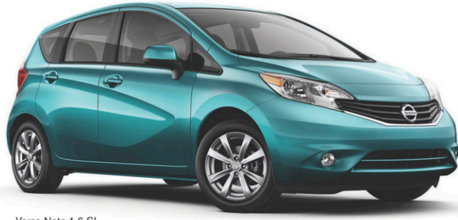
Versa Note 1.6 SL avec ensemble technologie illustrée**