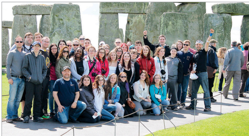
Cette année, 33 étudiants et six professeurs ont participé au voyage à Londres organisé par le Cégep Beauce-Appalaches.