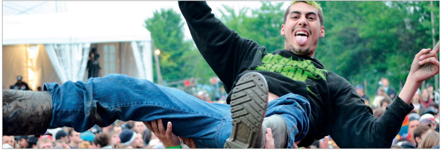
Woodstock en Beauce se déroulera jusque dans la nuit du 29 juin.

Les renseignements complets sur l'événement sont disponibles au www.woodstockenbeauce.qc.ca . Surveillez les pages Facebook et Twitter de l'Éclaireur Progrès pour en savoir davantage sur l'ambiance au sein du festival.