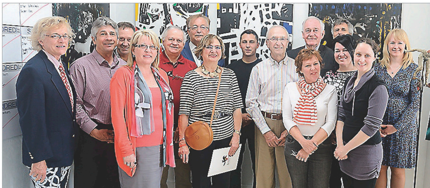
L'organisation de Beauce-Art a dévoilé ses nombreux partenaires

L'activité recrutera dix sculpteurs internationaux. Plusieurs partenaires