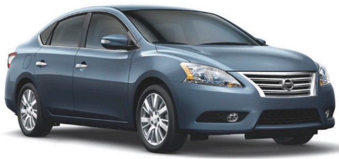
Sentra 1.8 SL illustrée*