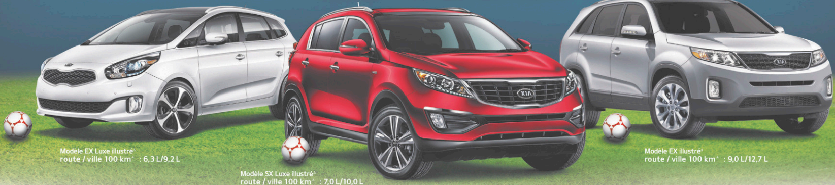
Modèle EX Luxe illustré* route / ville 100 km 3 : 6,3 L/9,2 L