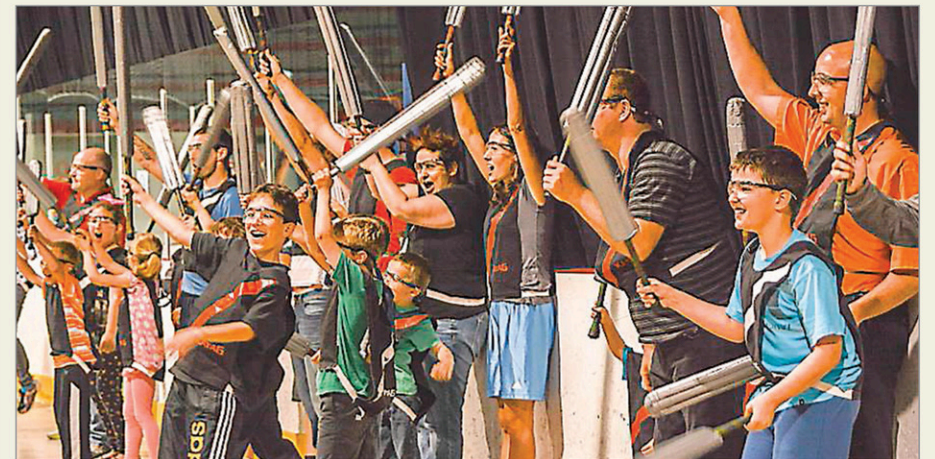
L'aréna de Lac-Etchemin est devenu l'arène d'un katag parents enfants.