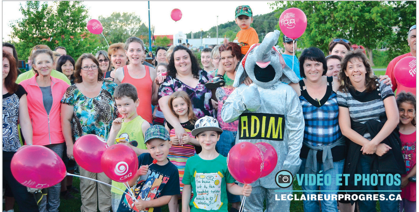
Les responsables de service de garde en milieu familial (RSG) en Beauce-Etchemins sont sans contrat de travail depuis novembre 2013.

Sur l'aspect financier, elles désirent obtenir cinq jours fériés supplémentaires, des vacances payées à 100 % et une augmentation de 15 % sur trois ans de la subvention gouvernementale. C'est ce dernier point qui permet aux parents de payer 7 $ par jour pour les services de