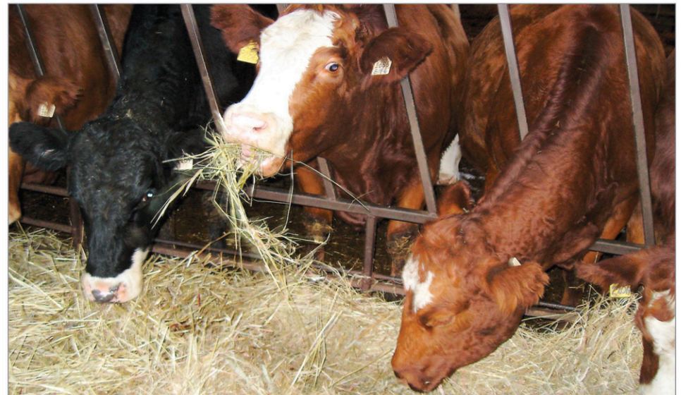
La Coopérative de bovins d'abattage du Québec veut acheter l'abattoir de Saint-Cyrille-de-Wendover, dans le Centre-du-Québec.

Au lieu de s'appuyer sur une production de masse, la coopérative travaille sur un concept nécessitant moins de bétail par semaine et qui s'appuiera sur un produit à valeur ajoutée. La CBAQ espère qu'Investissement Québec tiendra compte de tous ces arguments dans son choix afin de relancer dès que possible le seul abattoir de bovins d'envergure de tout l'est du Canada.