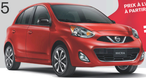
Micra SR illustrée**