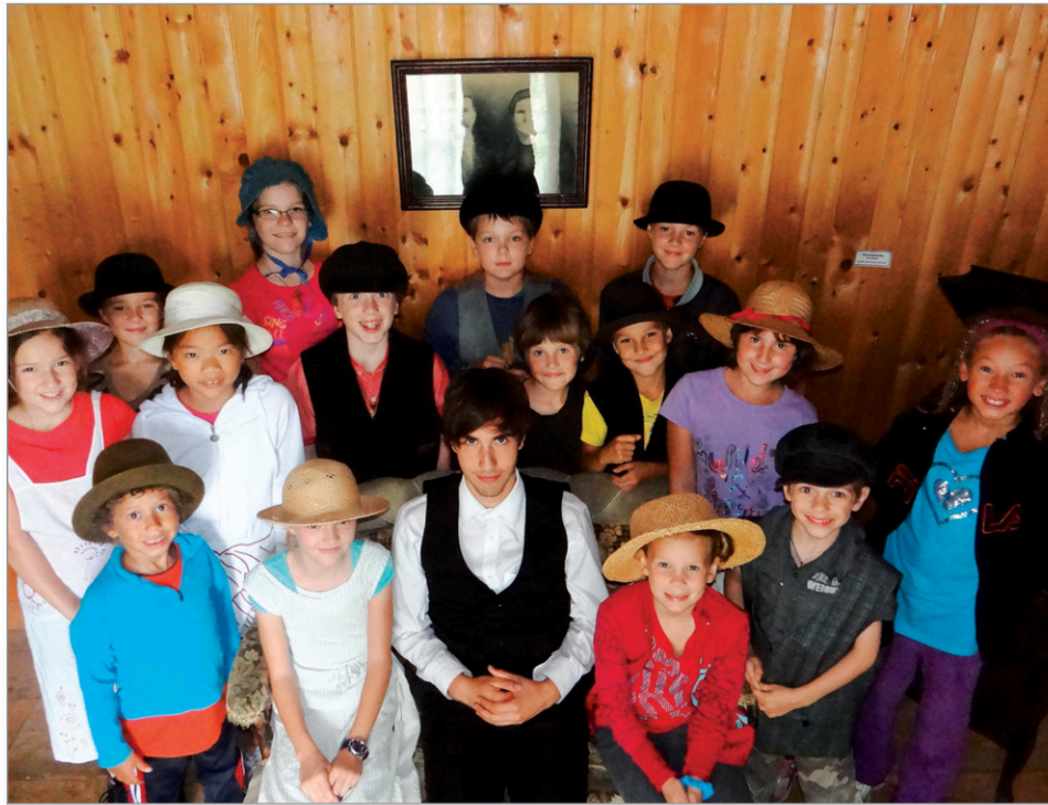
Un groupe de jeunes du camp de 2013.