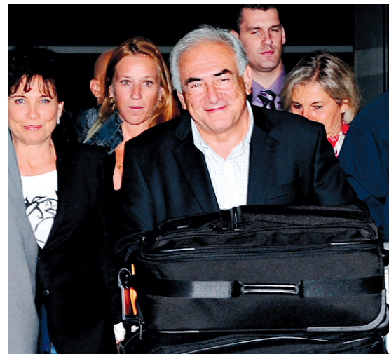
Dominique Strauss-Kahn à son arrivée à Paris dimanche