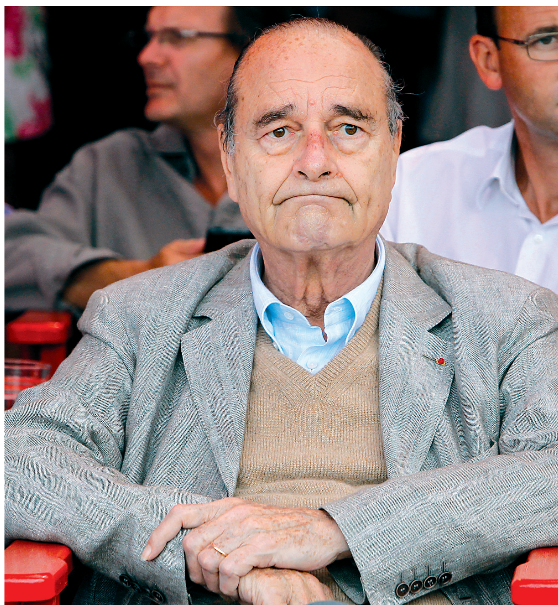
Jacques Chirac à la terrasse d'un restaurant de Saint-Tropez, le 14 août dernier

Poursuivi pour «détournements de fonds publics»