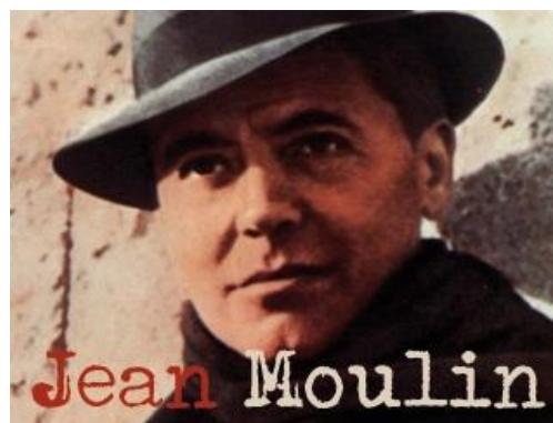
Jean Moulin, résistant français