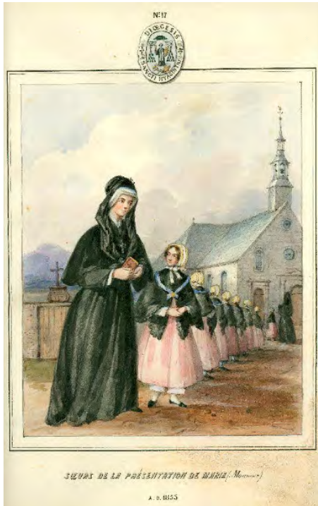
Sœurs de la Présentation de Marie (Monnoir) James Duncan - 1853