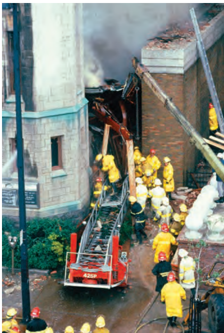
Commencement des fouilles.

l'extrême par l'adrénaline. Certainement. Mais il y eut aussi en jeu cet instinct de survie qui, chez le pompier, se transforme en instinct de « sauve-la-vie ». Hissé pouce par pouce, Ménard demeura en suspension au milieu de flammes plus vives encore. Et il pensa cuire. Un jet d'eau salutaire vint tout à coup d'en haut et quelques secondes plus tard, il était sorti d'affaires.