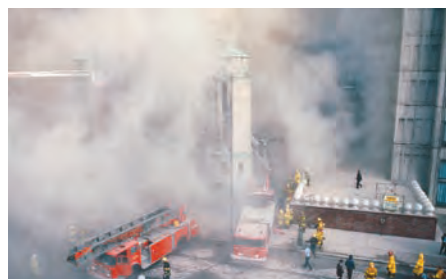
L'effondrement vient de se produire.