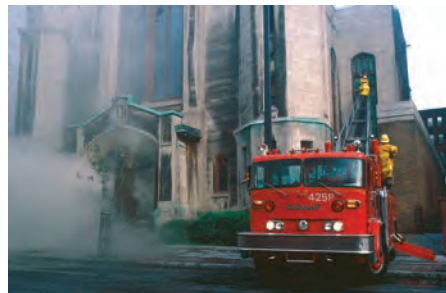
Sous le regard du pompier Carmel Turcotte, conducteur de l'échelle 425, les pompiers Létourneau et Longpré effectuent à l'aide de crochets de la ventilation en perçant les vitraux.

Une grande qualité des pompiers expérimentés consiste à être toujours en mesure de prévoir à chaque instant l'imprévisible. Un incessant calcul des probabilités a lieu tout au long de l'intervention. Comme au jeu d'échecs, il faut prévoir le plus de coups possible. Dans un environnement de flammes et de fumée, chaque geste implique ou non des conséquences, et un seul faux pas peut être fatal. Si les pompiers sont passés maîtres dans l'art de minimiser les effets de l'imprévisible, ils ne peuvent cependant rien contre les coups portés par le destin dans sa forme la plus néfaste, ce qu'on appelle la fatalité. Les pompiers de la caserne 3, Pierre Létourneau, 31 ans, et Jean-Pierre Longpré, 32 ans, l'ont rencontrée le 25 mai 1987 à 6 h 22 alors qu'ils se trouvaient dans l'échelle 425 en extension à 65 pieds le long du mur est de l'église unitarienne (Unitarian Church of the Messiah), rue Sherbrooke Ouest. Sur les lieux de l'incendie, ils occupaient théoriquement la position où le risque était le moindre. Ils assuraient la ventilation de la nef en cassant des vitraux avec leurs gaffes quand le toit s'effondra et fit s'écrouler la partie supérieure du mur. L'échelle fut arrachée de son socle par la chute des tonnes de pierres de taille qui écrasèrent les pompiers. Rien à faire pour les secourir. Leur sort était joué.