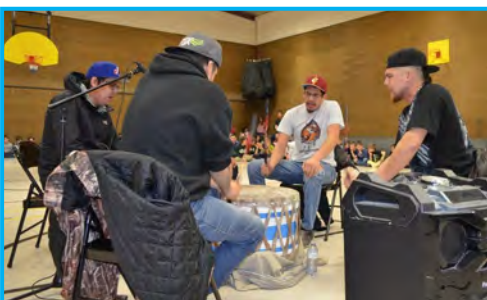
Le groupe Eastern Sound Singers a livré une prestation fort appréciée.