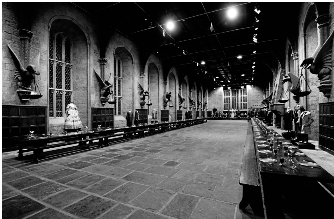
Le hall d'entrée de Poudlard est l'un des décors les plus impressionnants de la visite The Making of Harry Potter .

L'univers du célèbre jeune sorcier se trouve ici reconstitué dans ses moindres détails. Le visiteur peut voir non seulement