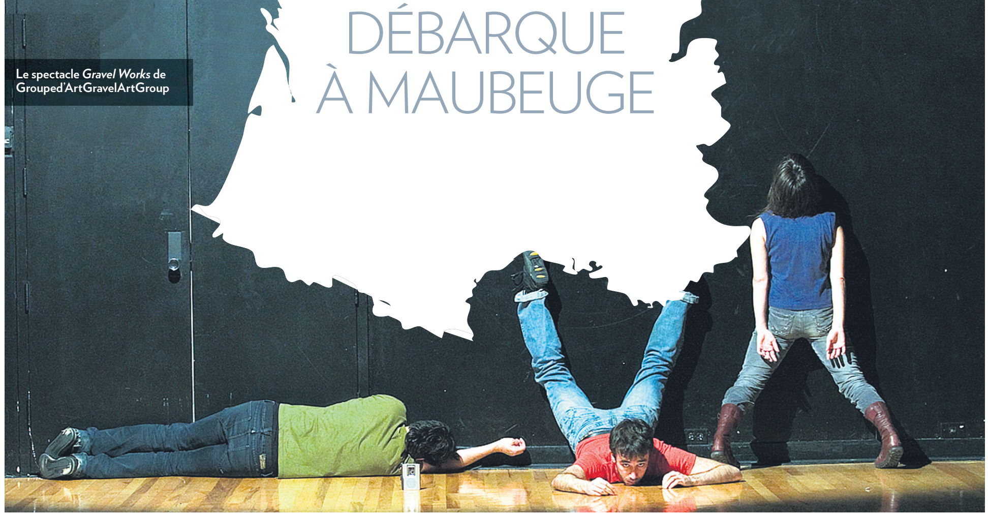
Le spectacle Gravel Works de Grouped'ArtGravelArtGroup