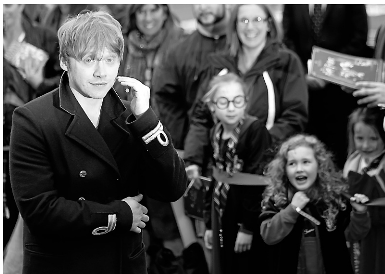
L'acteur Rupert Grint (interprète de Ron Weasley) a fait une apparition samedi à l'ouverture officielle du studio à Watford, près de Londres.

le pull tricoté par M me Weasley et les boîtes de céréales Cheery Owls, mais aussi les bouteilles de potions et des os d'animaux. Sans compter plus de 17 000 boîtes de baguettes magiques, peintes à la main.