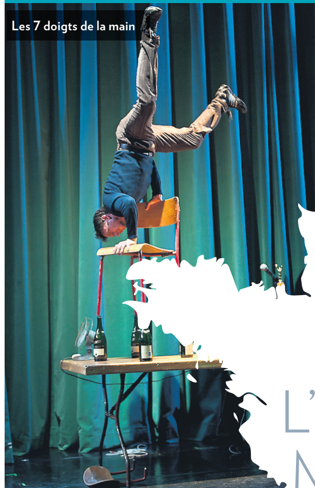
Les 7 doigts de la main