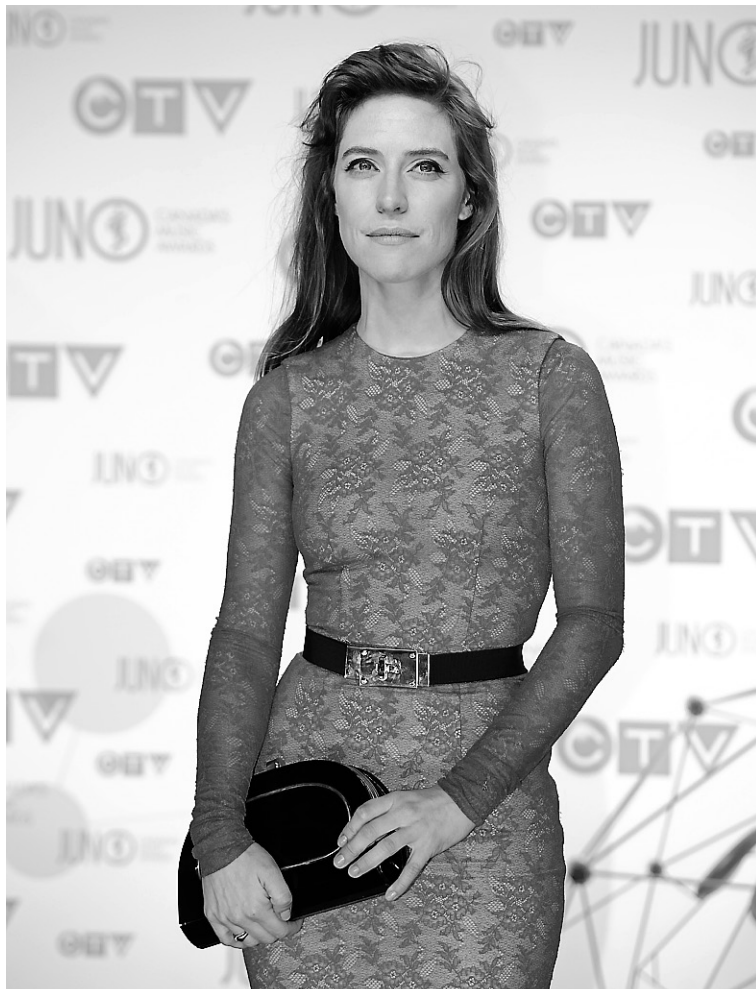
Feist a remporté le prix de l'artiste de l'année au gala des Juno hier soir.

Mais revenons au plus important, c'est-à-dire les gagnants. Il n'y a pas eu de raz-de-marée comme celui d'Arcade Fire l'an dernier. Le groupe rock de Saskatchewan The Sheepdogs a néanmoins gagné trois prix, soit ceux du single rock, de l'album rock et du nouveau groupe de l'année. Le groupe était hélas! absent: il est en tournée en Australie avec John Fogerty.