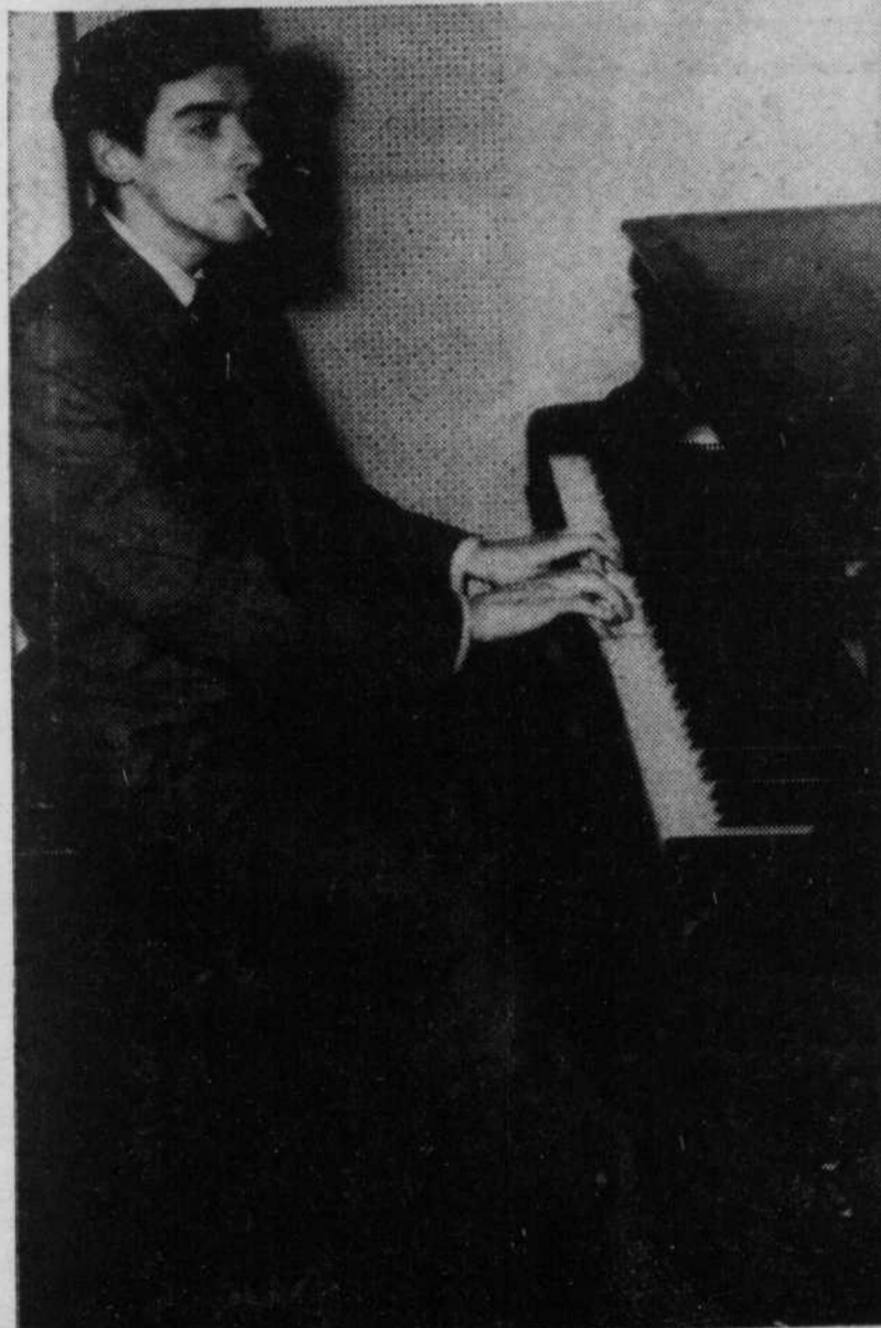
"Dans la vie, je suis (mauvais) pianiste!"