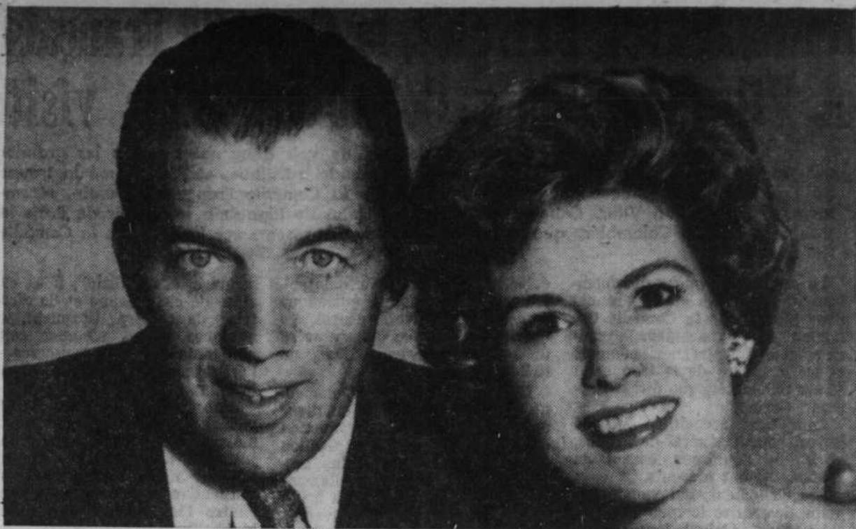
Ed Sullivan et sa "vendeuse" Julia Meade, à Montréal.