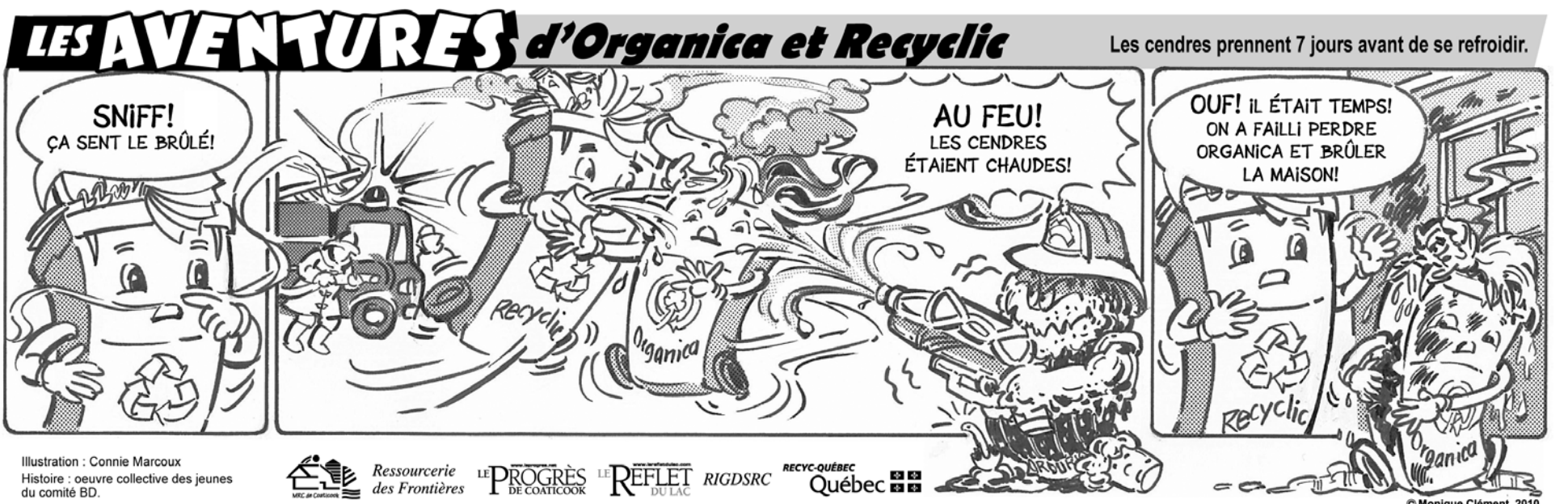
Illustration : Connie Marcoux Histoire : oeuvre collective des jeunes du comité BD.

Le petit Ramoneur | Propriétaire : Paul Labbé | Tél. : 819 823-7307 Ramoneur Expert D. Gingras | Tél. : 819 596-1282