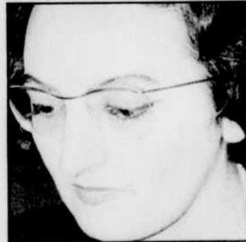
Yvonne LORIOD sera entendue à «Musique sacrée», à 19 h 30.