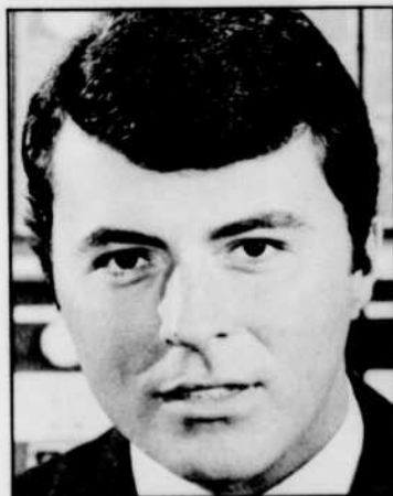
James DARREN, une des vedettes d'«Au coeur du temps», à 21 h 00.