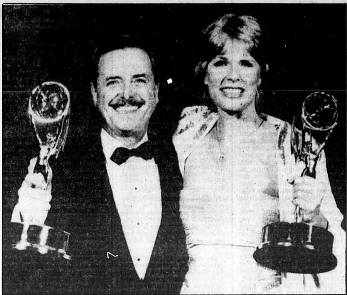
Les récipiendaires des prix du meilleur acteur et de la meilleure actrice dans la catégorie des dramatiques: William Daniels ( St. Elsewhere ) et Sharon Gless ( Cagney & Lacey ).

Le livre pourrait avoir un certain succès. Si c'est le cas, l'Oeuvre Jésus le Nazaréen, dirigée par les pères Trinitaires, en tirera un certain profit puisque les soeurs veulent lui verser une partie importante de leurs droits d'auteur.