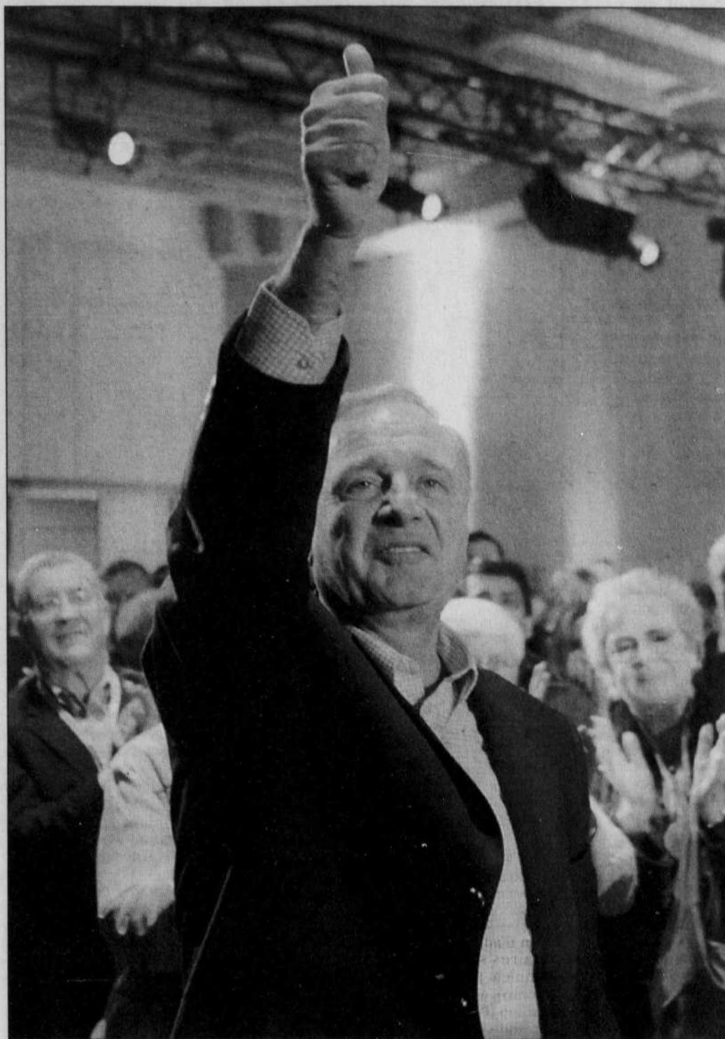
Paul Martin a manifesté sa joie à Sheila Copps, qui s'adressait aux délégués hier au congrès à la direction du Parti libéral du Canada.