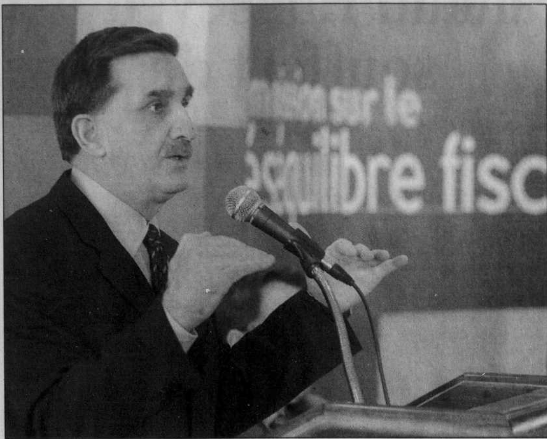
Yves Séguin, lors de la présentation du rapport de la Commission sur le déséquilibre fiscal, en mars 2002

Le déséquilibre fiscal est un problème structurel et non conjoncturel. Il commande des solutions durables pour aujourd'hui et pour demain. L'objectif est clair: il faut que la distribution des ressources fiscales