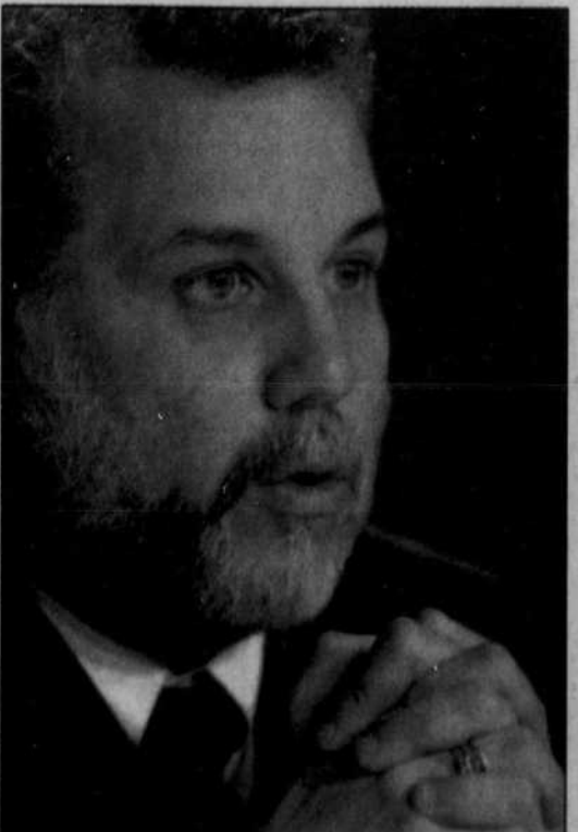
Le ministre Couillard lors de la présentation de ses projets de loi.