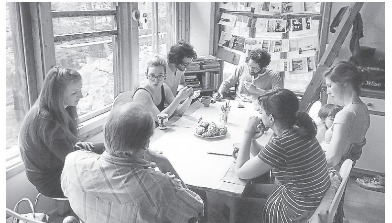
L'artiste, quatre femmes et un bébé prenaient part à l'expérience.

« Le but de cette commune, dit-il, était de repenser le monde en terme collectif et non en terme de temps ou d'argent, ce qui est très subversif. Ce que je retiens surtout de l'expérience, c'est l'idée d'horizontalité : tout le monde égal, au