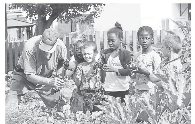
Les enfants du Carré Joyeux ont pu, grâce aux jardiniers bénévoles, expérimenter le plaisir de jardiner cet été.