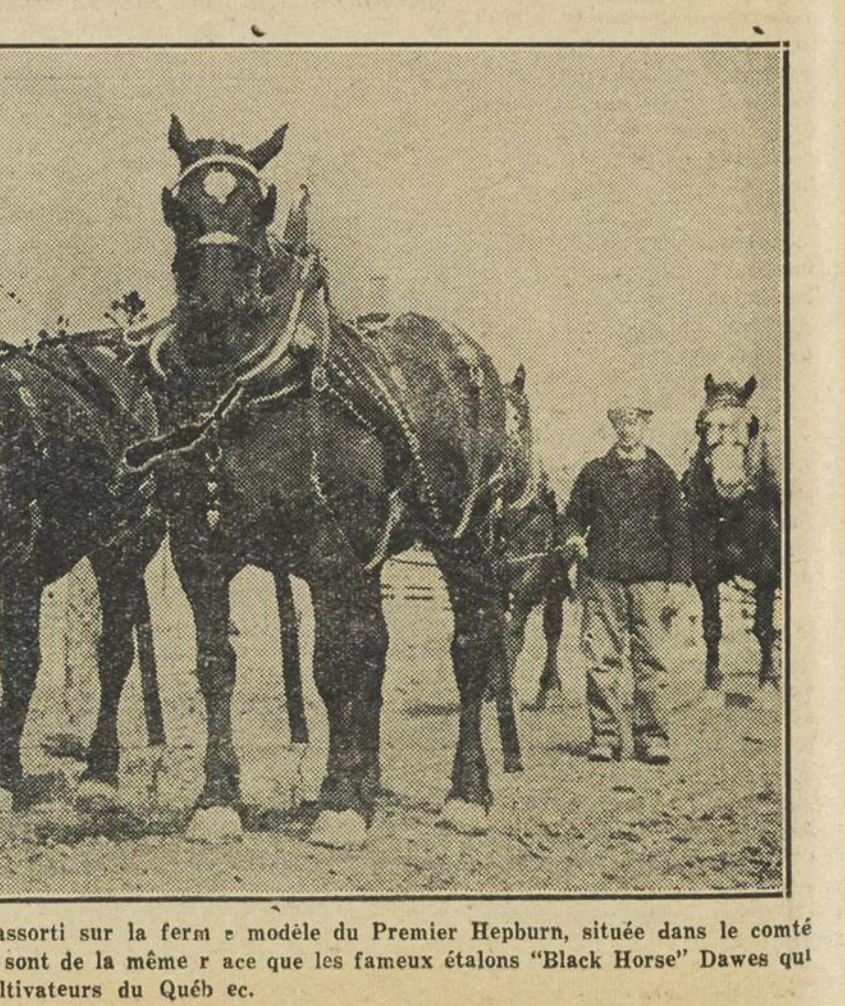
Un attelage de percherons bien assorti sur la ferme modèle du Premier Hepburn, située dans le comté d'Elgin, Ontario. Ces chevaux sont de la même race que les fameux étalons "Black Horse" Dawes qui sont à la disposition des cultivateurs du Québec.

NEURALGOL FAGUET (en tablettes) Est sans égal pour soulager rapidement les maux de tête, la grippe, les rhumes, les douleurs rhumatismales ou névralgiques. Prix 25 cts partout. 16—J.N.O.