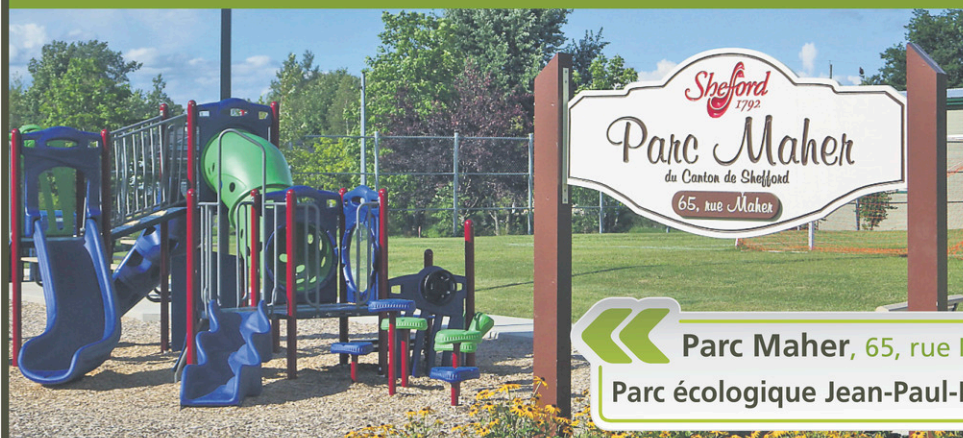
« Parc Maher, 65, rue Maher Parc écologique Jean-Paul-Forand, 167, chemin Picard »