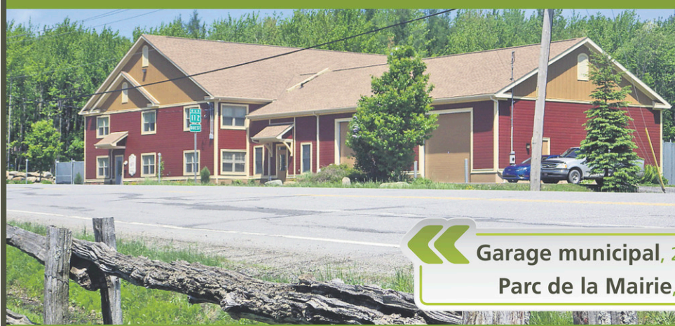
« Garage municipal, 218, rue Robinson Ouest Parc de la Mairie, 209, rue Robinson Ouest »