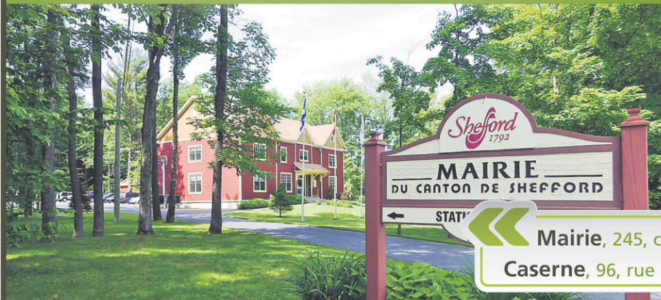
« Mairie, 245, chemin Picard Caserne, 96, rue Raymond-Lemieux »