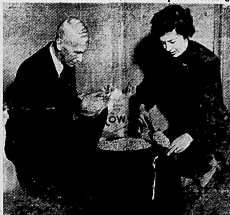
En vue d'assurer au monde de plus amples moissons, l'Organisation pour l'alimentation et l'agriculture (OAA) des Nations Unies expédie des maïs hybrides pour l'ensemencement en Europe et en Proche-Orient. En Italie, par exemple, les maïs hybrides permettent un rendement de 50 pour cent supérieur à la production antérieure. On voit ici des membres de la division de l'agriculture de l'OAA emballer des semences hybrides à destination de pays frappés de disette.