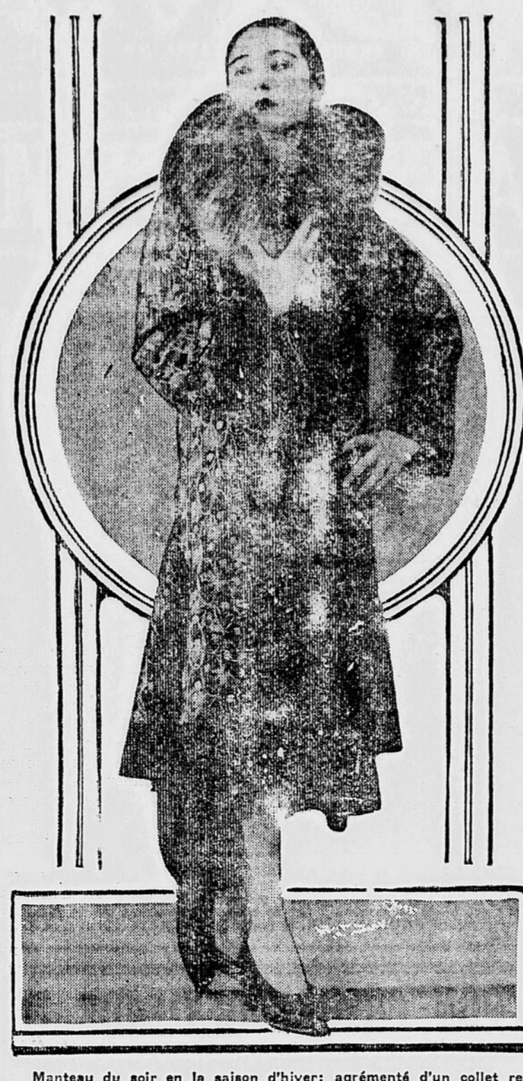
Manteau du soir en la saison d'hiver; agrémenté d'un collet renard gris formant un harmonieux avec l'ensemble.