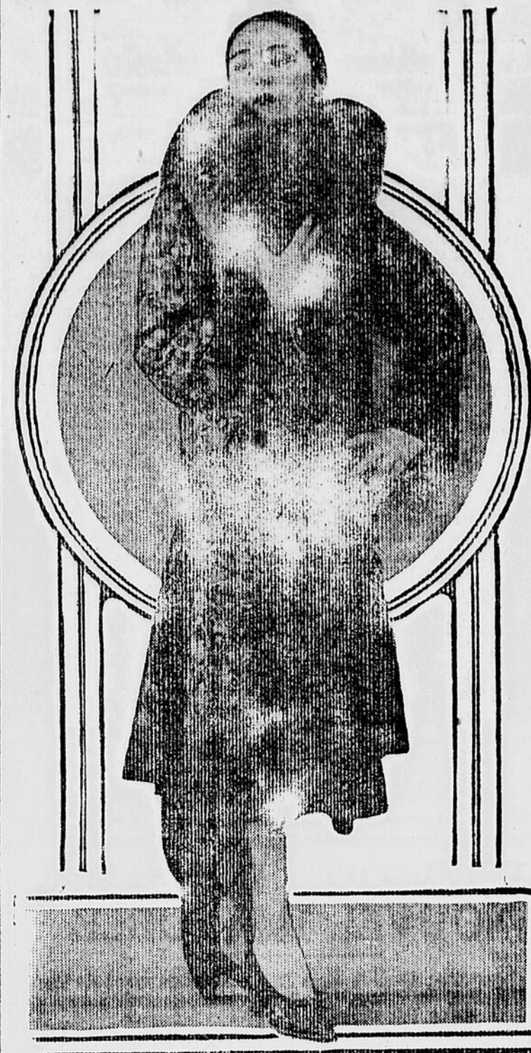
Manteau du soir en la saison d'hiver; agrémenté d'un collet renard gris formant un harmonieux avec l'ensemble.