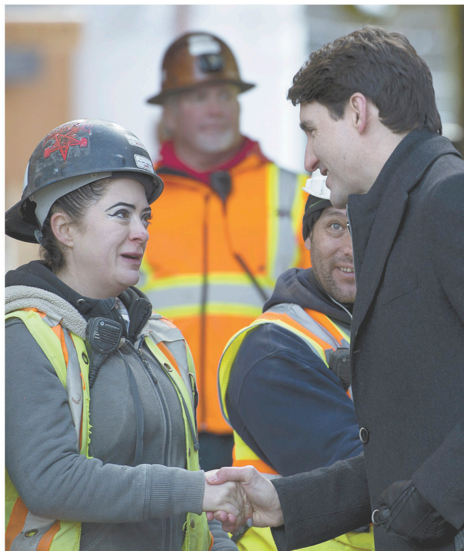
Justin Trudeau était à Vancouver lundi, où il a notamment visité un chantier de construction. Le premier ministre a toutefois été à nouveau interpellé sur le dossier de SNC-Lavalin.