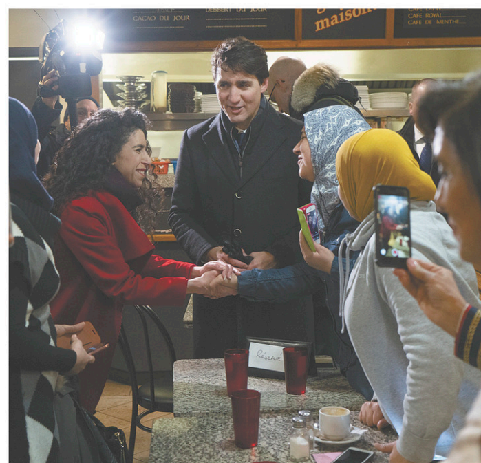
Conscient de l'enjeu de cette élection complémentaire, Justin Trudeau a fait campagne avec sa candidate à la fin janvier.