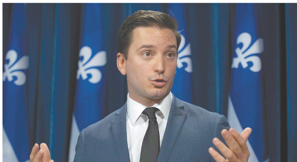
Le ministre Simon Jolin-Barrette a tenté d'éteindre les feux, lundi, en multipliant les entrevues avec les journalistes.

M me Wilson-Raybould refuse de faire tout commentaire sur l'histoire du Globe and Mail , qu'elle n'a cependant jamais démentie, en invoquant le secret professionnel qui la lie au gouvernement. M. Scheer et Singh demandent à M. Trudeau de lever ce secret. Il a indiqué avoir demandé à son nouveau ministre de la Justice, David Lametti, de « regarder cet enjeu et de [lui] faire des recommandations ».