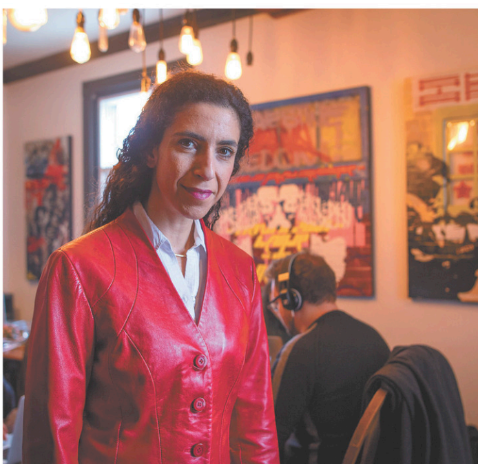
La libérale Rachel Bendayan est allée chercher en 2015 un tiers des votes face à Thomas Mulcair.