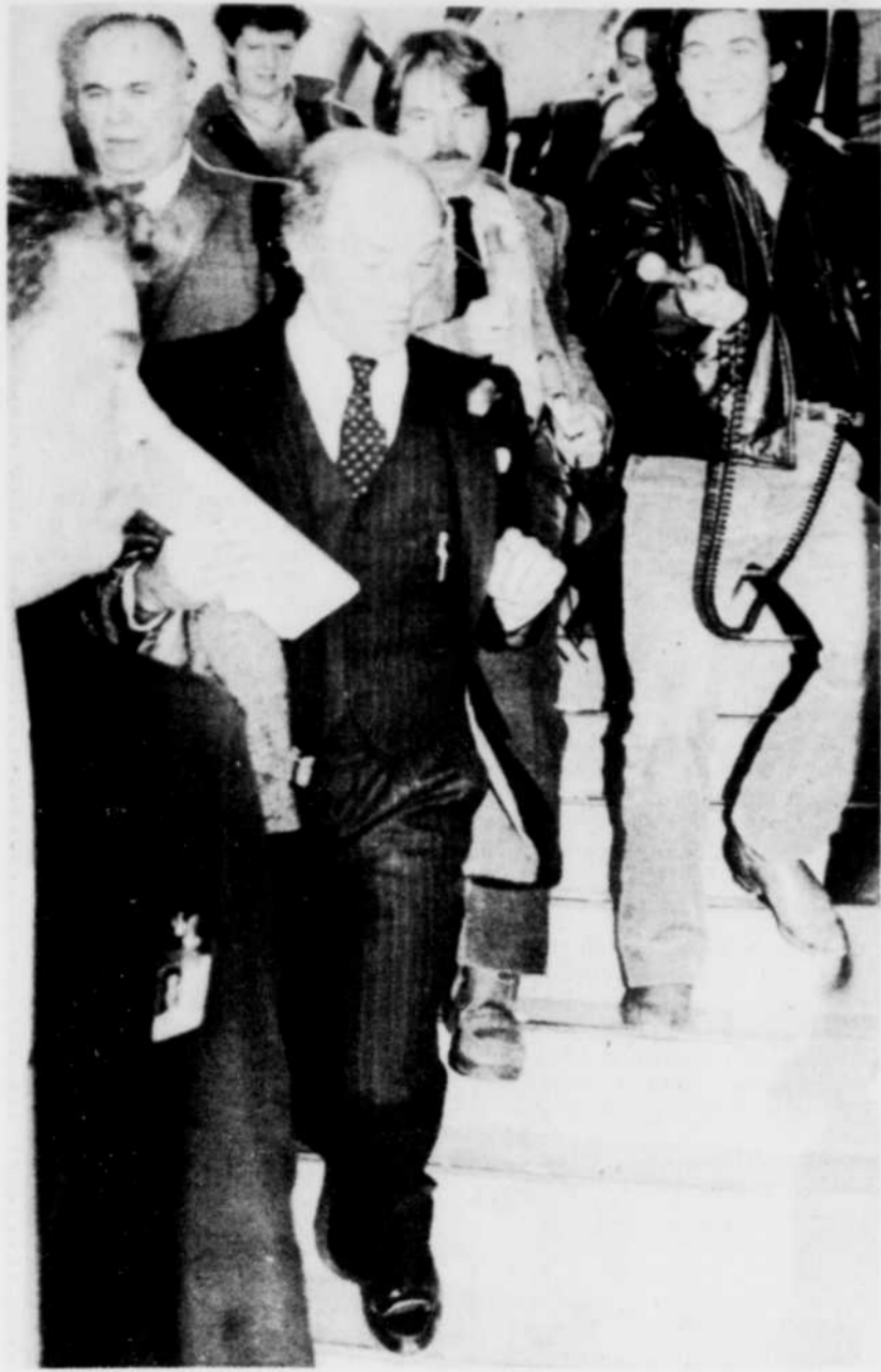
Le premier ministre Trudeau, sous l'oeil attentif d'un garde du corps, se fraie un passage parmi les journalistes au Parlement, alors que des rumeurs de démission prochaine circulaient sur la colline parlementaire.

Le premier ministre se moque des journalistes qui le harcèlent