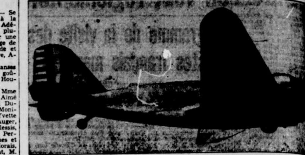
Un avion de bombardement de l'aviation américaine fit récemment une envolée d'essai à l'île Field, s'éleva à 150 pieds, et l'un des deux moteurs manqua. A l'atterrissage, l'avion vira vers le sol et prit feu en touchant terre. Au bout d'une heure, on va à l'intérieur les cadavres des neuf membres de l'équipage.