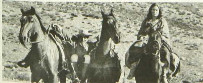
Burt Lancaster et Susan Clark dans «Valdez»