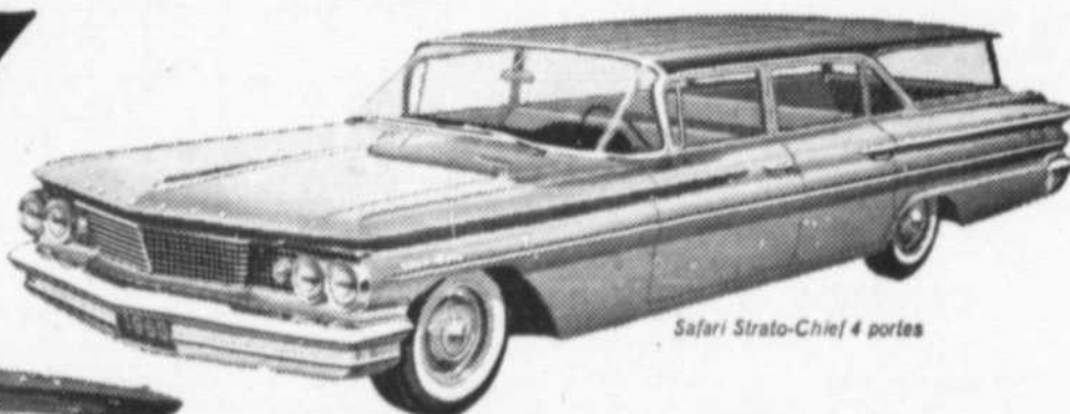
Safari Strato-Chief 4 portes