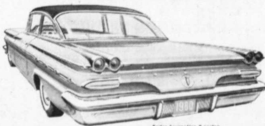
Sedan Laurentian 2 portes

Quelles que soient les qualités que vous exigez d'une nouvelle voiture, vous êtes sûr de les trouver réunies dans celle que vous offre votre concessionnaire Pontiac.