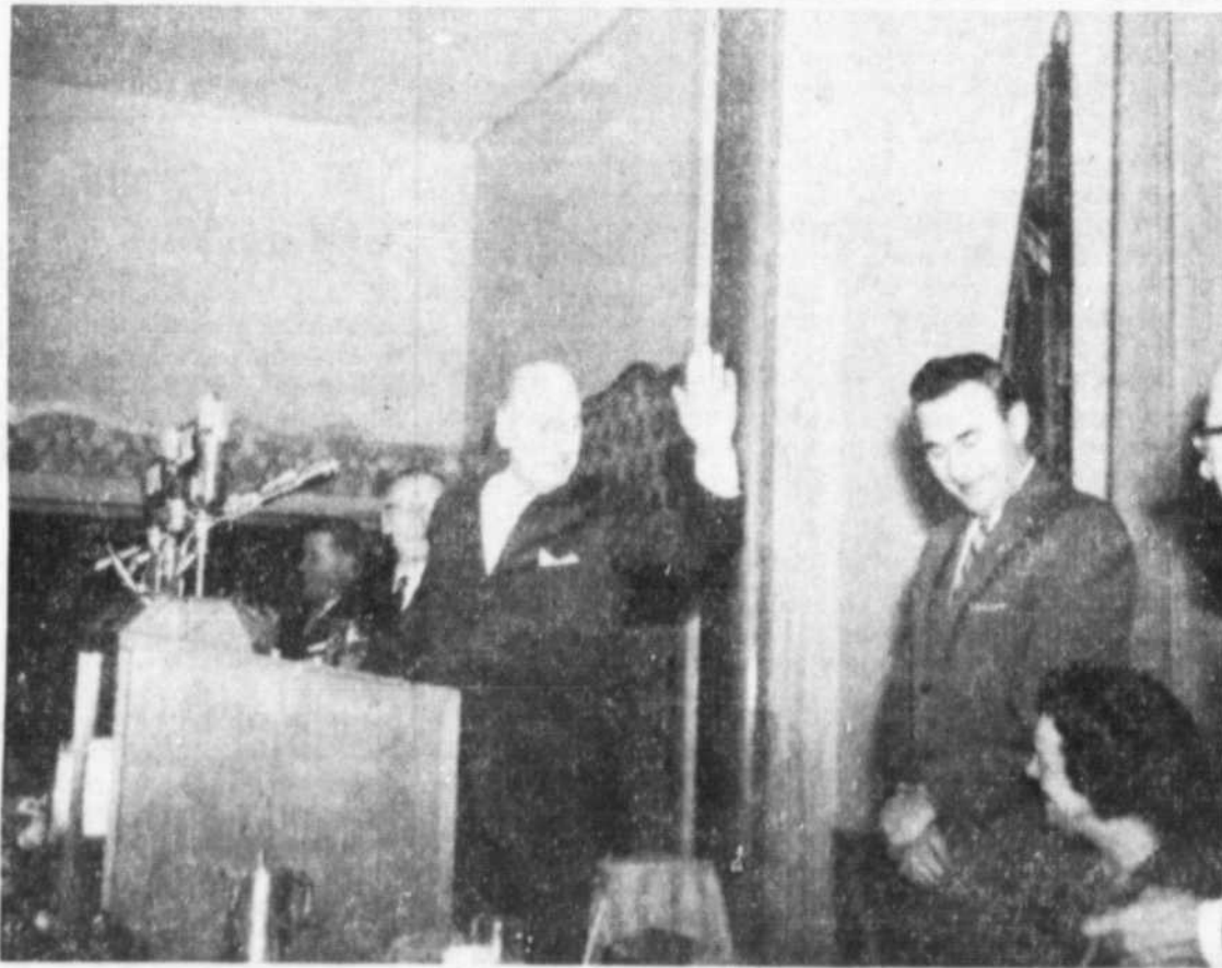
L'Honorable Roméo Lorrain, Député de Papineau et Ministre des Travaux Publics, dans le cabinet Provincial, prononçait une confé-

rence au deux-ème diner-causerie de l'Union Nationale section de Montréal. On remarque sur cette photo prise à l'Hotel Reine Elizabeth, de g. à d.: M. Lionel Blan-