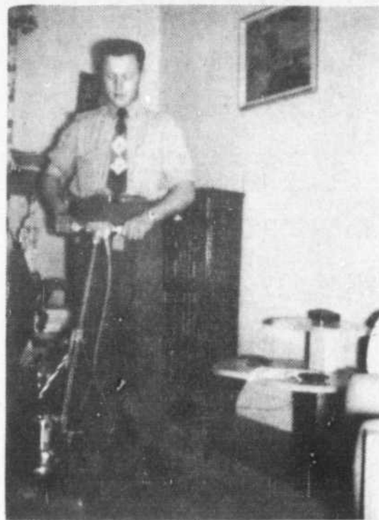
C'est le temps de faire nettoyer vos tapis. Town & Country Cleaners vous offre un équipement des plus complet et tout ce qui est de plus moderne dans les machineries pour nettoyer les tapis. Signalez YUkon 6-2811 aujourd'hui, pour un service prompt et courtois.

Si vous totalisez plus de 10 OUI, on peut dire que vous maîtrisez la