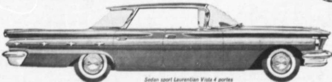
Sedan sport Laurentian Vista 4 portes