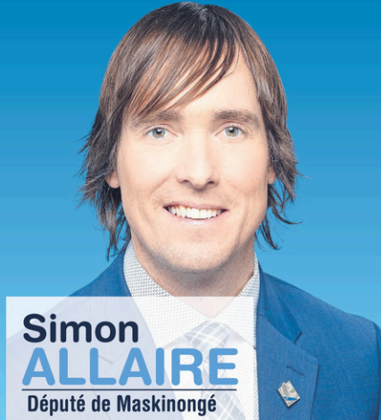
Simon ALLAIRE Député de Maskinongé