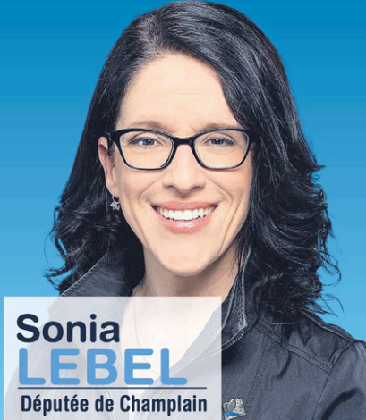
Sonia LEBEL Députée de Champlain