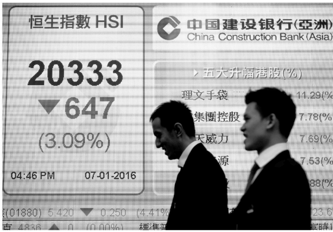
À Hong Kong, deux hommes passent devant un écran qui relaie les cotes de la Bourse.

Le huard a continué de retraiter par rapport à la monnaie américaine, clôturant à 70,94 ¢ US, en recul de 0,08 ¢ US.