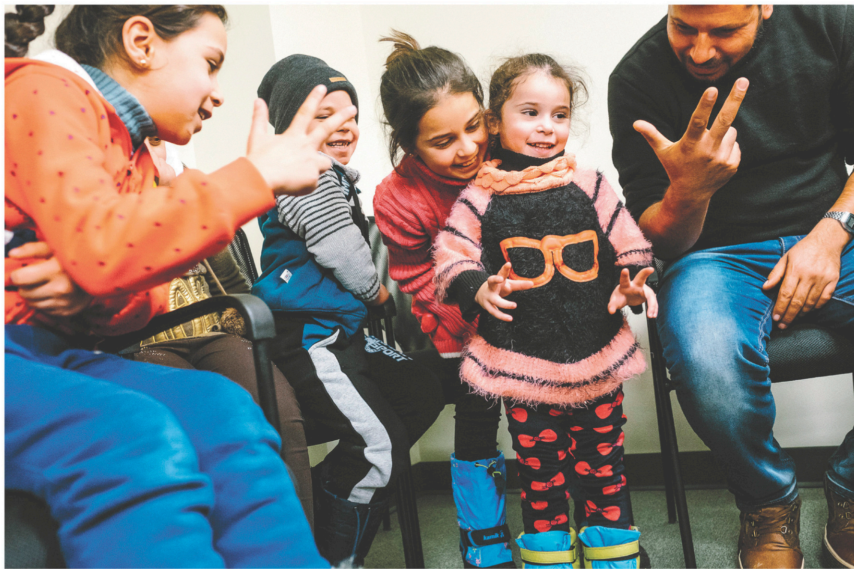
RENAUD PHILIPPE LE DEVOIR

voyer jusqu'à 150 membres de forces spéciales entraîner les Kurdes; d'envoyer des soldats de l'armée régulière entraîner les forces irakiennes; d'entraîner les Irakiens en Jordanie; d'entraîner la police irakienne et de bonifier l'aide humanitaire; ou encore d'envoyer des commandos des forces spéciales mener des opérations clandestines en Irak et en Syrie.