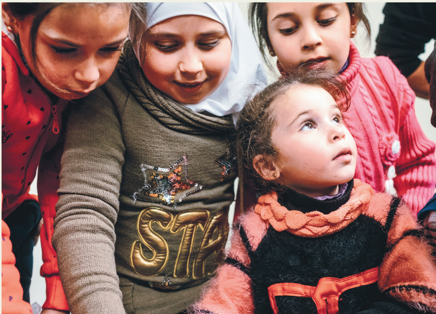
RENAUD PHILIPPE LE DEVOIR

RÉFUGIÉS : ACCUEILLIR CEUX QUI PARTENT, AIDER CEUX QUI RESTENT