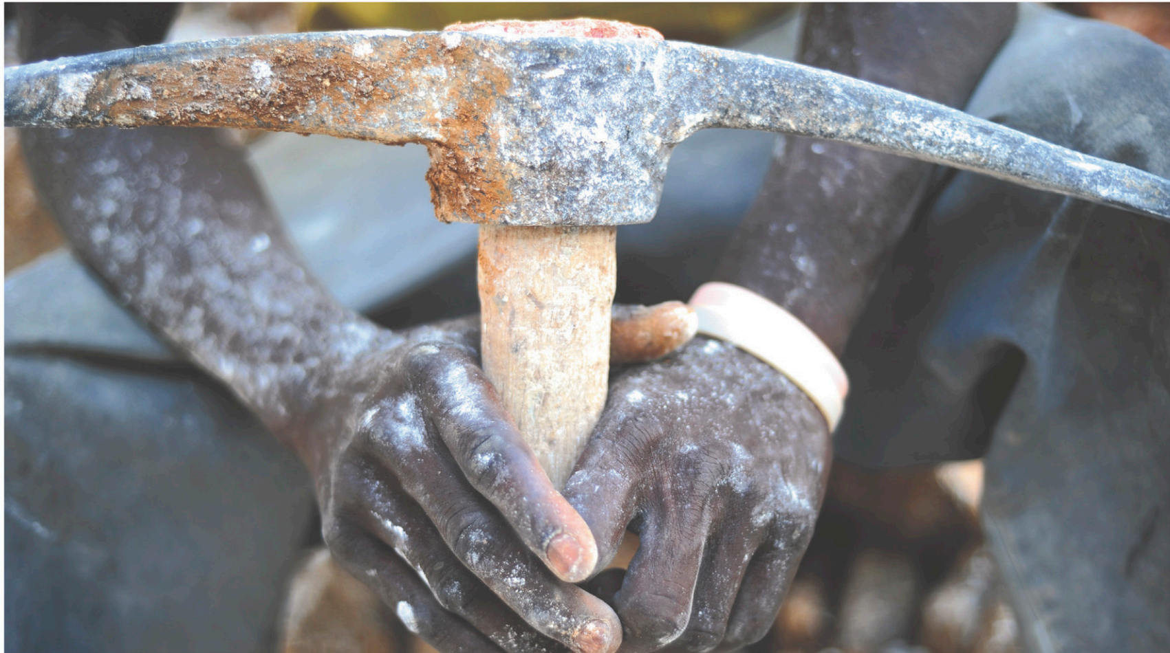
Les mains d'un travailleur minier près de la capitale Port-au-Prince. Le Canada a financé 43% de la totalité des fonds mis à la disposition de l'instance haïtienne vouée à la modernisation de la loi minière d'Haïti entre 2009 et 2014.