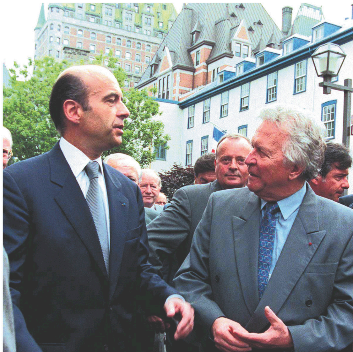
En 1996, le maire de Bordeaux, Alain Juppé, est venu visiter son homologue de Québec.

La capacité réflexive de Jean-Paul L'Allier se lit également dans les quelque 150 substantielles chroniques hebdomadaires qui paraissent dans Le Devoir au milieu des années 1980