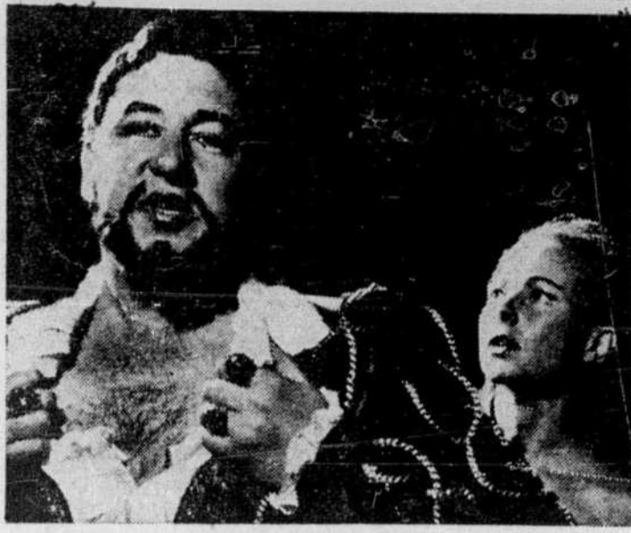
Philippe Noiret et Geneviève Page sont, aux côtés de Gerard Philipe, deux des interprètes du drame de Musset "Lorenzaccio", qui sera joué au cours de la prochaine visite du T.N.P. à Montréal.