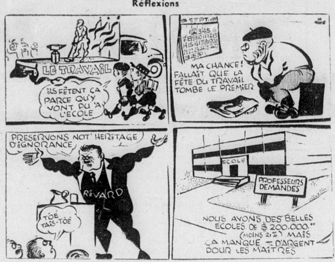
sur un thème d'actualité

Le point de vue de l'économiste A quoi M. Raymond Aron rétorque que le choix entre une orientation vers l'intégration ou vers l'autonomie n'est pas un choix, "pour la simple raison que l'intégration est impossible".